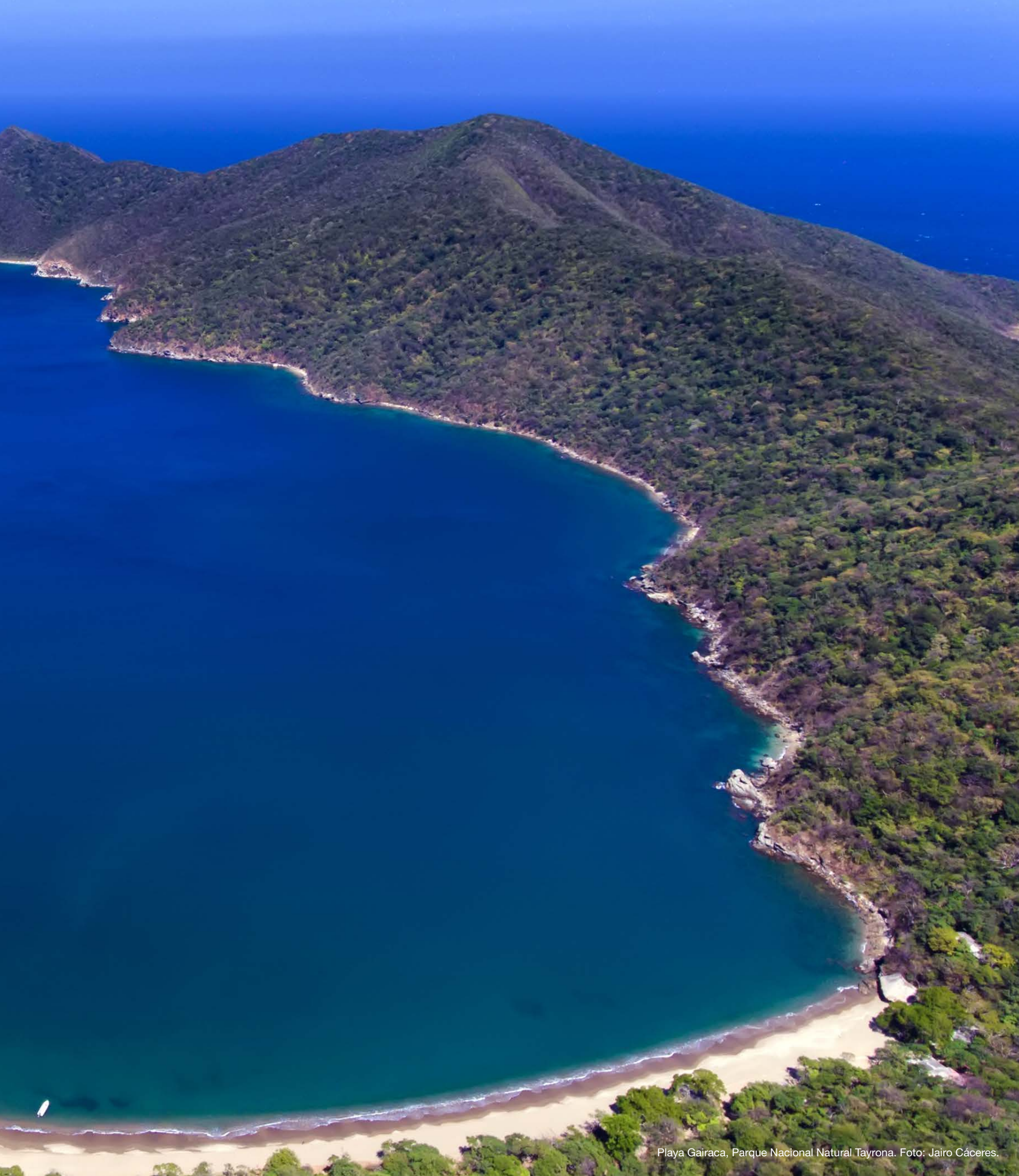
Playa Gairaca, Parque Nacional Natural Tayrona.