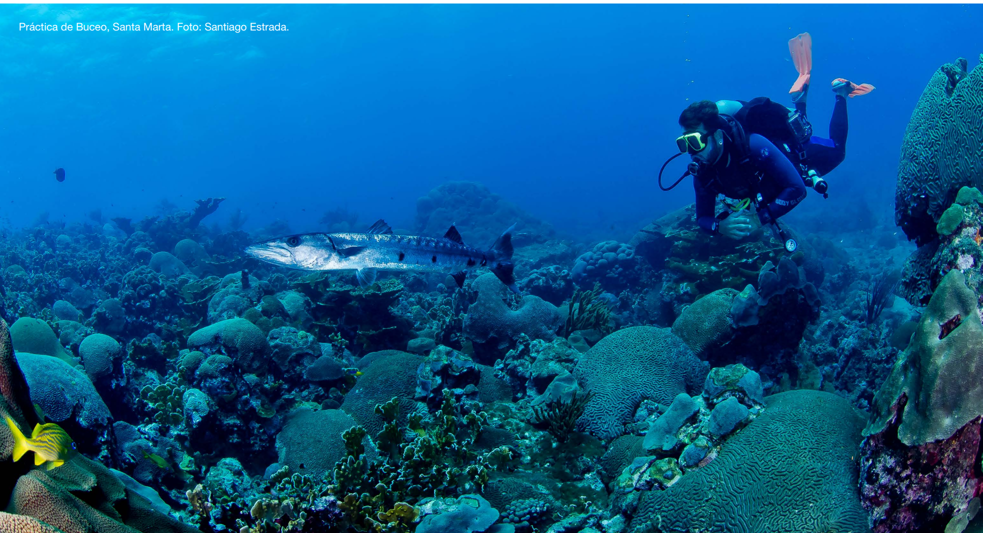
Práctica de Buceo, Santa Marta.

Tenemos que aprender a ser ambiciosos en la concepción y firmes en la ejecución de los proyectos. Tenemos que unir esfuerzos, privados y públicos, nacionales e internacionales, si queremos transformar el Magdalena en un territorio de paz y bienestar. Entre todos, si apuntamos en la misma dirección y sin mezquindades, podremos extraer de la tierra la gran zanahoria del progreso, como nos enseña el hermoso cuento de Gianni Rodari. Solo así, uniendo voluntades, haremos del turismo en el Magdalena un renglón pujante, generador de riqueza y de miles de empleos dignos para nuestra gente. El turismo es la vía. ●