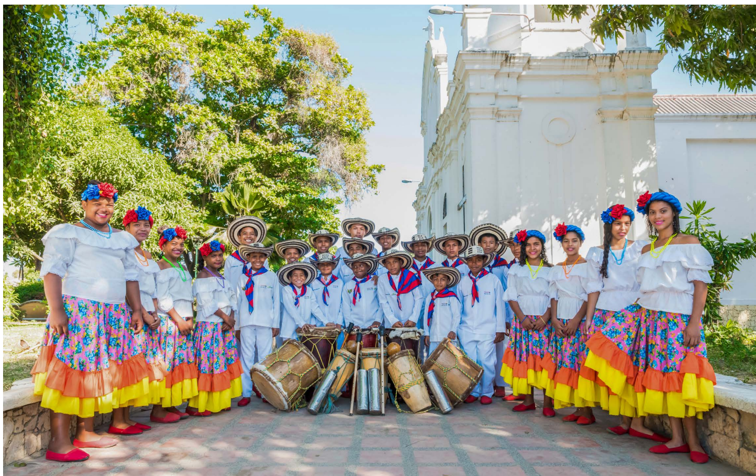
Escuela de Música Magdalena Macondo Big Band, Río Frio (Zona Bananera).

El Centro Histórico fue declarado Monumento Nacional en 1996. En su casco urbano, en 1902, se escenificó una de las últimas escaramuzas de la Guerra de los Mil Días (1899-1902), y en la finca Neerlandia, perteneciente hoy al municipio de Zona Bananera, se firmó el tratado de paz del mismo nombre, instrumento con el que se puso final al histórico conflicto. Este episodio histórico motiva algunas páginas de Cien años de soledad . La antigua capital del banano fue escenario de unos de los episodios más cruentos y tristes de la historia nacional: La Masacre de las Bananeras (1928), suceso recreado magistralmente en las novelas La casa grande (1962), de Álvaro Cepeda Samudio, y Cien años de soledad (1967), de Gabriel García Márquez. En algunas casas del Centro Histórico fue filmada la película colombiana Juana tiene el pelo de oro (2007), dirigida por Luis Fernando “Pacho” Bottía e inspirada en el libro Los cuentos de Juana (1972).