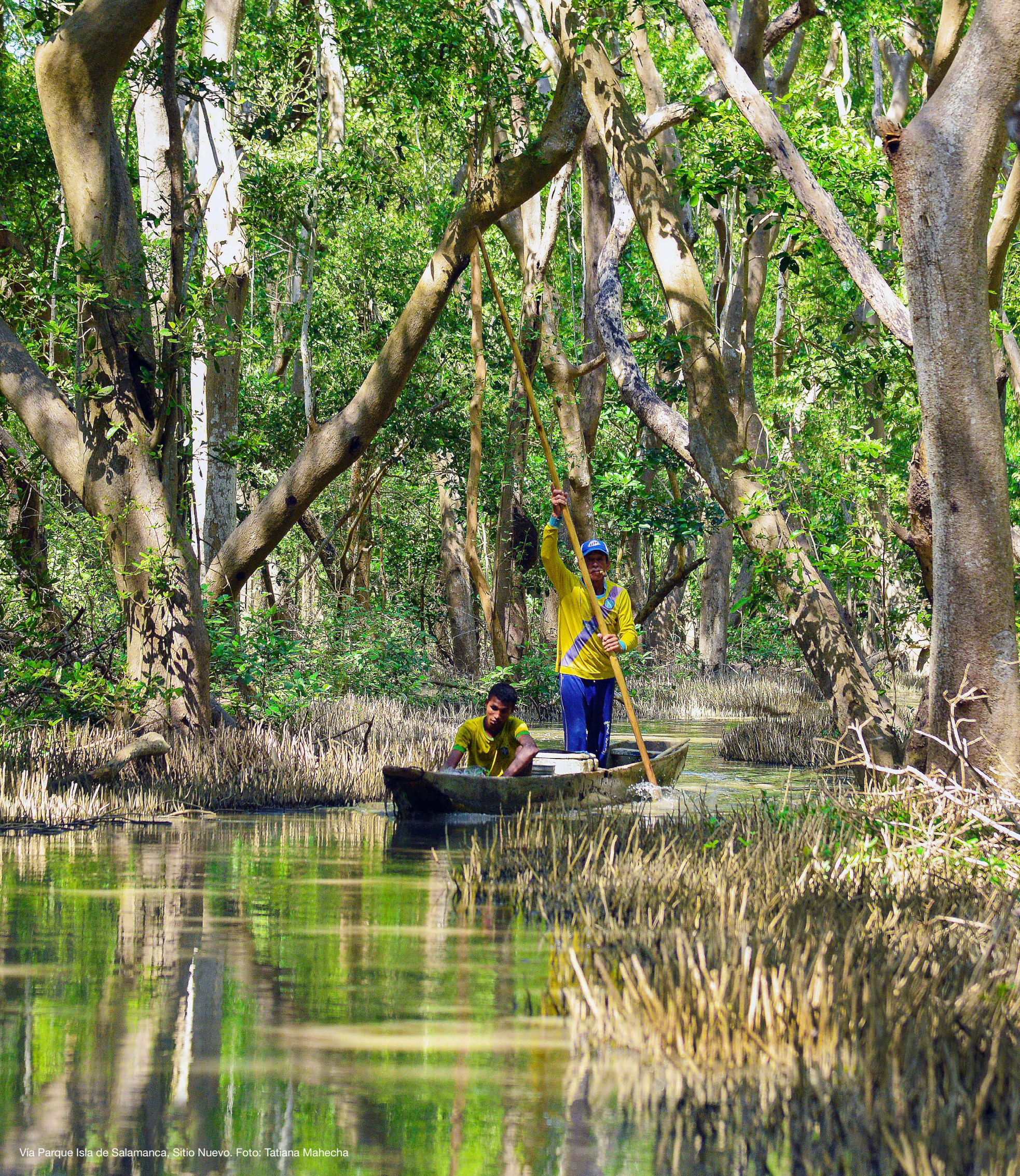
Vía Parque Isla de Salamanca, Sitio Nuevo.