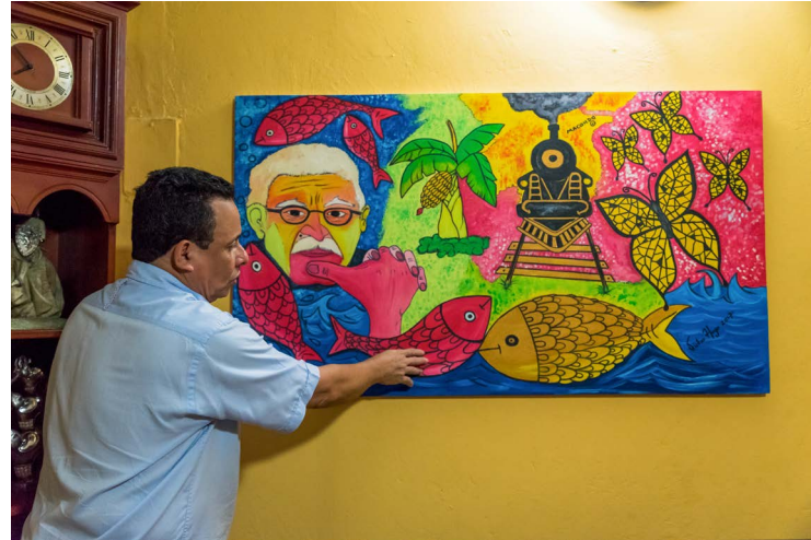
Gabo en Macondo de Victor Hugo Vidal, Ciénaga.

En Ciénaga nació el renombrado músico y compositor Guillermo Buitrago (1919-1949), el iniciador de la industria fonográfica en el país, y en cuyo honor se celebra el Festival Nacional de Música con Guitarra Guillermo Buitrago. Su fiesta emblemática es el Festival de la Leyenda del Caimán, celebrada todos los años para el 20 de enero, día de San Sebastián.