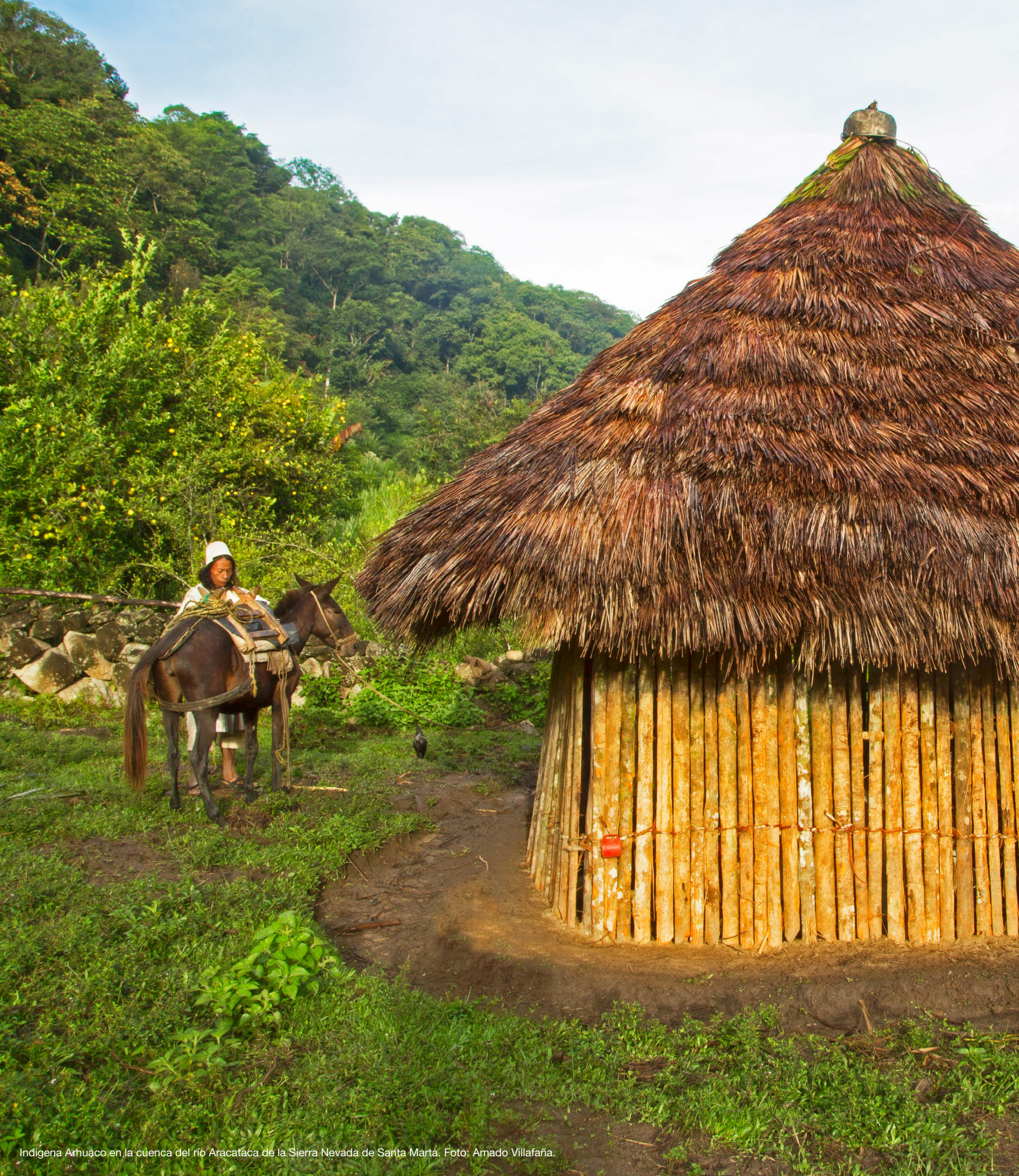
Indígena Arhuaco en la cuenca del río Aracataca de la Sierra Nevada de Santa Marta.