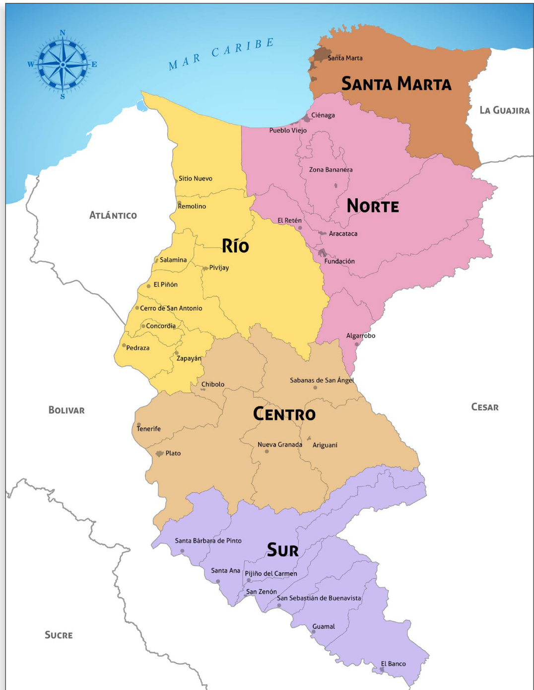
Mapa político administrativo del Magdalena. Ilustración: Andrés Moreno Toro