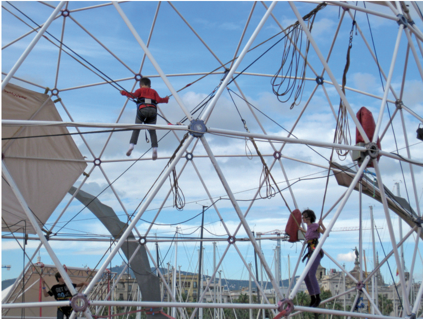
Abb. 1-3 Dynamische Vernetzungen von klein auf

Wir sollten allerdings im Auge behalten, dass selbstorganisierte Teams nicht nur eine Sache effektiver Zusammenarbeit sind. Heutzutage verlangen viele Wissensarbeiter nämlich selbst einen hohen Grad an Autonomie. Sie wollen selbstständig denken und handeln, statt bloß Instruktionen zu folgen. Und sie wollen lieber in Teams als alleine arbeiten. Schenkt man diversen Trendscouts Glauben, möchten die Millennials mit Spaß bei einer Sache sein, die für sie Sinn macht. Dazu gehört auch die Transparenz, inwiefern ihre Leistung zum Gesamterfolg des Unternehmens beiträgt. Hoch qualifizierte Wissensarbeiterinnen werden, so die Scouts, in Zukunft noch stärker auf Rahmenbedingungen achten, die gute Arbeit und ihre eigene Weiterentwicklung fördern. Und sie werden Unternehmen bevorzugen, deren Kultur zu ihrem Selbstwertgefühl passt [Viljakainen & Müller-Eberstein 2012].