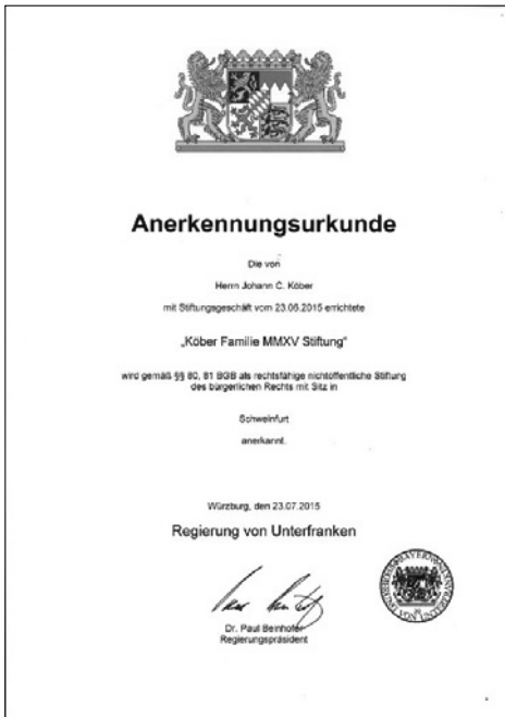
Abbildung 3: Stiftungsurkunde

nichts dergleichen. Stifter klagen offensichtlich sehr selten; und sollte es doch zu Unstimmigkeiten kommen, klärt der Stifter sie meist direkt mit der Stiftungsaufsicht. In der Praxis helfen diese lockeren Bande dabei, einerseits sehr gut und einvernehmlich mit den Behörden zusammenzuarbeiten und andererseits doch die eigenen Vorstellungen weitgehend umsetzen zu können. Der oben zitierte Gesetzestext fordert lediglich das sogenannte Stiftungsgeschäft – die Einzelheiten erläutere ich noch – und leitet daraus den Anspruch des Stifters auf Anerkennung ab. Auf Deutsch heißt das: Wenn Sie alles im Sinne der durchaus weit gefassten Vorgaben erledigen, muss der Staat Ihre Stiftung anerkennen. Sie können somit also eine eigene Rechtsperson Stiftung gründen. Und genau darum soll es in diesem Buch gehen: um Stiftungen, die von den jeweiligen Behörden als solche anerkannt wurden und über eine entsprechende Urkunde (siehe Abbildung 3) verfügen.