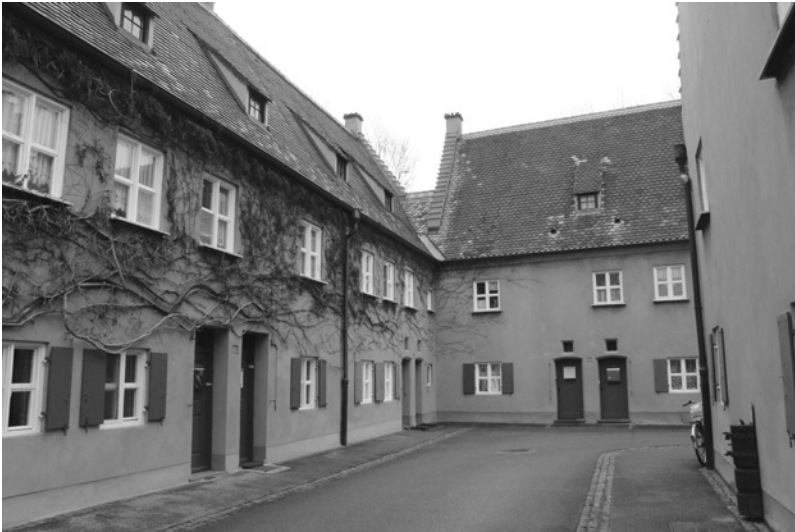
Abbildung 1: Die Fuggerei in Augsburg.

dings selbst aufkommen. Fugger hat zudem festgelegt, dass jeder Bewohner einmal täglich ein Vaterunser, ein Glaubensbekenntnis und ein Ave Maria für den Stifter und die Stifterfamilie sprechen muss. Noch immer wird die Fuggerei aus dem Stiftungsvermögen Jakob Fuggers unterhalten. Für die Verwaltung ist die Fürstlich und Gräfllich Fuggersche Stiftungs-Administration zuständig.