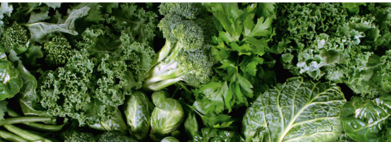
Viel Gemüse ist ein wesentlicher Bestandteil der Low-Carb-Ernährung.

Prinzipiell solltest du alle Nahrungsmittel sorgfältig und mit Bedacht auswählen. Frische Zutaten, gerne als Bio-Qualität, ergeben eine gesunde, nährstoffreiche Mahlzeit. Auch Tiefkühlware (TK-Ware) wie beispielsweise tiefgefrorenes Gemüse oder Beerenobst kann bedenkenlos verwendet werden. Tipp: TK-Ware ist in der Regel viel besser als