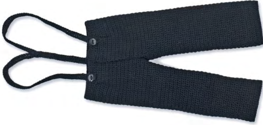
✕ HOSE Ezy 7/8 aus Jersey, Uniqlo