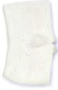
✕ BOXERSHORTS MUJI 100 % Bambusfaser