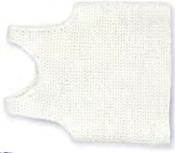
TANKTOP ✕ Aus Bio-Baumwolle, Costes