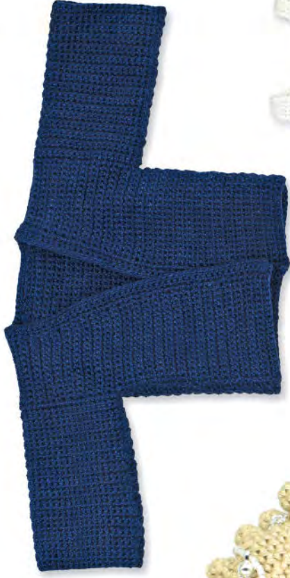
HAORI JACKE ✕ Unisex, Muji