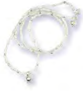
SILBERHALSKETTE MIT PERLEN ✕ Monsieur Paris, handgefertigt in Paris