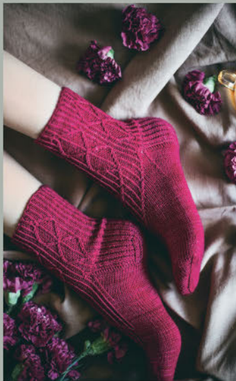
Alberne Liebe SOMMER