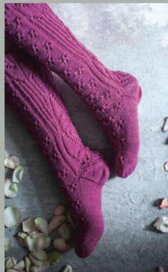
Die Zauberhaften FRÜHLING