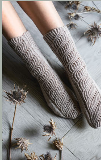
Seelenverwandte III HERBST