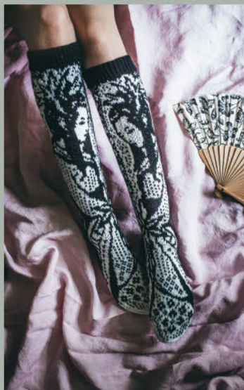
Zur Zeit der Kirschblüten FRÜHLING