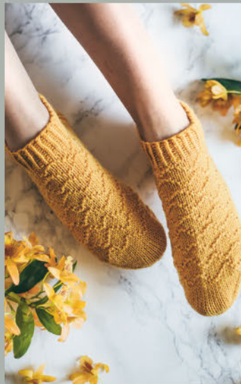
Gold im Haar SOMMER