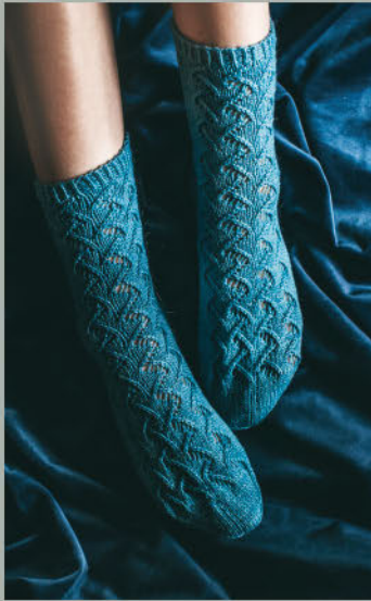
Die Eismeere WINTER