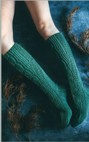
Die Grenzenlosen HERBST