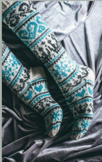
Die Schneekönigin WINTER