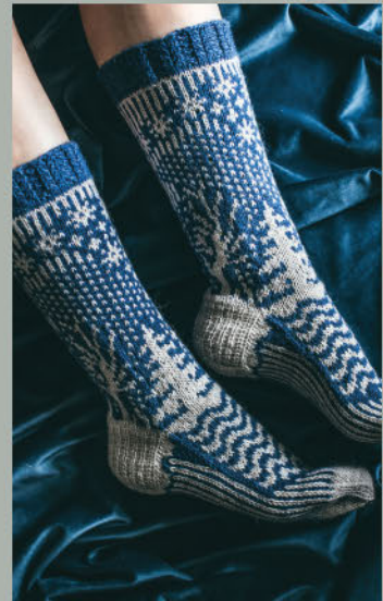
Am Tiilikka-See HERBST