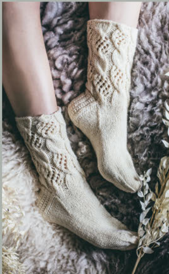
Still und leise WINTER