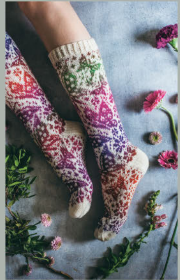
Meine Schwestern SOMMER