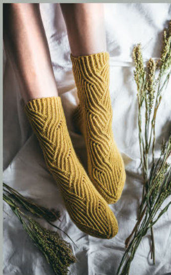
Für einen Moment FRÜHLING