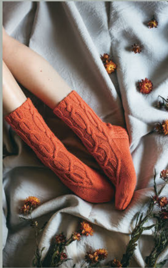
Lachender Wanderer FRÜHLING