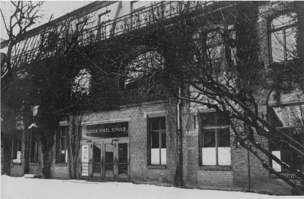
Abb. 4: Theodor-Herzl-Schule am Kaiserdamm, Berlin