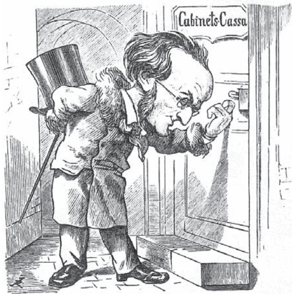
Abb. 3: »Nur ein vorübergehender Besuch«. Karikatur im Münchener Punsch (Band 20, Nr. 11, 17. März 1867) zu Wagners Kurzbesuch in München im März 1867

Am 9. März 1867 ist Wagner wieder in München. Er trifft dort den neuen Ministerpräsidenten Hohenlohe-Schillingsfürst sowie König Ludwig II., von dem er sich 12 000 Gulden ausbezahlen lässt (siehe Abb. 3), und dessen Verlobte, Prinzessin Sophie in Bayern (die Schwester der legendären Sissi). Dem König verspricht er, zu dessen geplanter Hochzeit im Herbst die Meistersinger von Nürnberg als Hochzeitsoper uraufzuführen – gerade so, wie es am Beginn der Gattungsgeschichte der Oper um 1600 in Florenz und Mantua der Brauch gewesen war. Dafür und auch für die Leitung der geplanten Deutschen Musikschule benötigt er freilich den Dirigenten Hans von Bülow, der im Vorjahr ebenfalls von München in die Schweiz geflohen war, entnervt von den Gerüchten über die Affäre seiner Frau mit Wagner. Es gelingt Wagner nun sogar, Bülow als offiziellen Münchner Hofkapellmeister zu installieren, womit dem 64-jährigen Franz Lachner nur noch der Rückzug in den Ruhestand übrig bleibt.