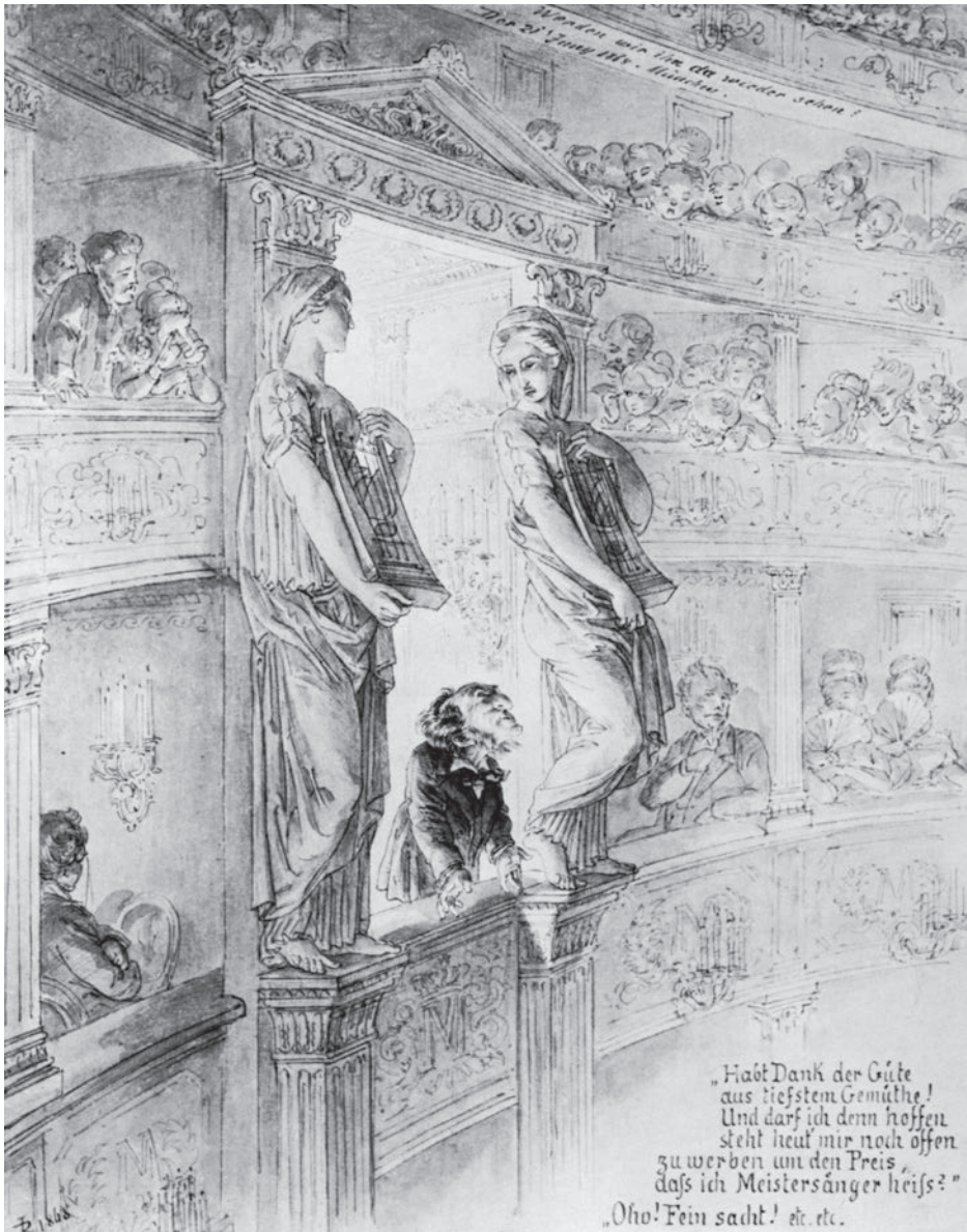
Abb. 4: Wagner dankt an der Brüstung der Königsloge des Münchner Hof- und Nationaltheaters dem applaudierenden Publikum bei der Uraufführung der Meistersinger von Nürnberg am 21. Juni 1868 (zeitgenössische Zeichnung von Joseph Resch, König Ludwig II. Museum Schloss Herrenchiemsee)