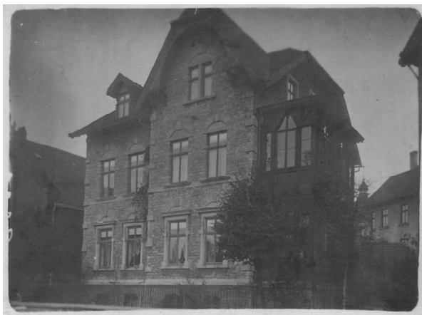
Abb. 3: Das Haus in der Leopoldstraße.