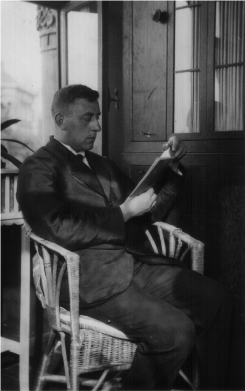
Abb. 8: Der Student, 1924.