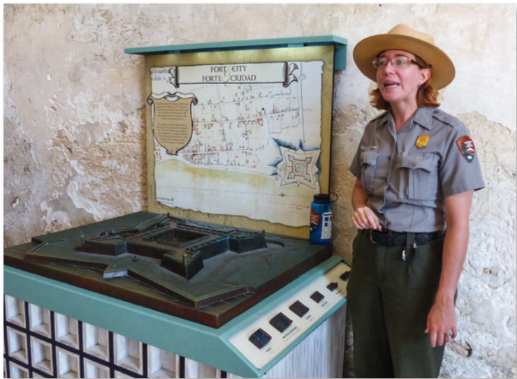
Riesige Ländereien sind in den USA dem National Park Service in verschiedenen Kategorien unterstellt

Park Ranger sind für das Wohlergehen von Park und Besuchern zuständig. Sie werden prinzipiell in vier Kategorien – Education & Interpretation, Maintenance, Administration und Law Enforcement – unterteilt; Letztere üben auf dem Parkgelände