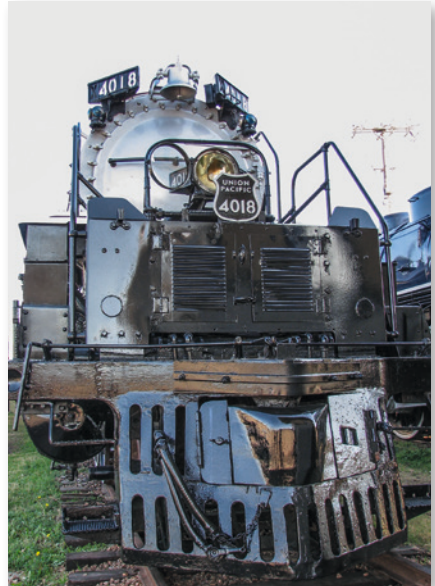
Die Erschließung des Westens wurde erst durch die Eisenbahn möglich

Nur dieser stete Kampf mit der Natur habe den USA „eine Position außerhalb der üblichen Regeln und Gesetze der menschlichen Geschichte verliehen“. Zudem hatte seiner Ansicht nach die Frontier zugleich als soziales Ventil gedient: Sobald sich die Bedingungen im Osten verschlechterten, blieb die Aussicht auf einen Neuanfang im Westen. Zudem war Turner davon überzeugt, dass der Prozess zu Ende des 19. Jh. abgeschlossen und die Frontier damit Geschichte geworden war.