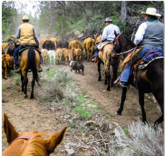
Cowboys und Rinder sind Teil des Nordwestens

Von der Kolonialzeit bis etwa 1920 wurden zur Schaffung von Agrarflächen riesige Flächen an Wald gerodet. Erst ab den 1930er-Jahren konnten dank staatlicher Programme und privater Umweltschutzinitiativen weitere Rodungen und, damit verbunden, Erosions-