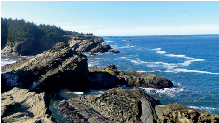
Von schroffer Schönheit: die Pazifikküste des Nordwestens, hier Cape Arago

bis zur Golfküstenebene erstreckt, das Appalachegebirge , das sich parallel zur Atlantischen Küstenebene von Kanada im Nordosten bis nach Alabama im Süden erstreckt, und die Atlantische Küstenebene , die sich vom Cape Cod im Nordosten bis nach Florida im Südosten zieht.