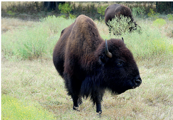
Symboltier des Westens: der Bison

Der Wolf ( Lupus lupus ) ist in ganz Nordamerika von Alaska bis Nord-Mexiko verbreitet. Sein ursprünglicher Lebensraum waren ausgedehnte Waldgebiete, und da diese heute großteils zerstört sind, ist sein Bestand zurückgegangen. Außerhalb von Schutzgebieten sind Wölfe heute kaum mehr zu sehen. Sie leben in Rudeln und können Tiere bis zur Größe von Rentieren erlegen. Der Hauptteil ihrer Nahrung besteht jedoch aus kleineren Tieren, und sogar Obst und Beeren werden nicht verschmäht.