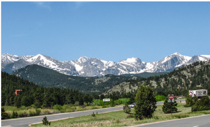
Grandiose Landschaften, wie hier in den Rockies, prägen den Nordwesten

von 45.000 km zahlreiche Vulkane; man spricht auch vom Ring of Fire . In einem rund 178 Mio. km 2 großen Gebiet liegen 75 % aller aktiven Vulkane der Welt. Es gibt heiße Quellen, Geysire und vulkanisches Gebiet noch weit im Landesinneren – bestes Beispiel ist der Yellowstone NP.