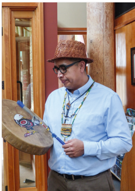
Indianer bilden die Urbevölkerung im Nordwesten

Nirgendwo in den USA leben mehr Ureinwohner als im Westen, und auch außerhalb der Reservate findet man in vielen Städten einen relativ hohen indianischen Bevölkerungsanteil. Doch entspricht das Bild weniger den edlen Klischeevorstellungen aus Filmen und Büchern – die Realität ist eine andere und zeigt auch schlechte Lebensbedingungen, Armut, Alkohol- und Drogenprobleme sowie Arbeitslosigkeit.