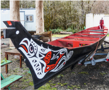
Indianer der Nordwestküste fertigen Kanus traditionell aus einem Baumstamm

Die Küsten-Indianer besiedelten den Küstenstreifen zwischen der Cascade Range bzw. der Sierra Nevada und der Pazifikküste. Diese Stämme erlangten bis zur Ankunft der Weißen einen gewissen Wohlstand : Die Flüsse und der Pazifik boten reichlich Fisch, das mild-feuchte Klima sorgte für holzreiche Wälder mit dichtem Wildbestand, und auch die Bedingungen für Ackerbau und das Sammeln von Früchten waren gut. Zum Norden hin, im Küstenstreifen der heutigen Staaten Oregon, Washington und British Columbia war damals zwar aus klimatischen Gründen Ackerbau nur in begrenztem Umfang möglich, doch lebten auch diese Stämme in Wohlstand. Das zeigte sich an ihrer Bau-