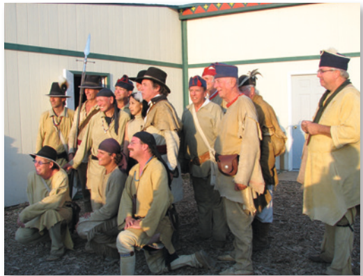
Die wegweisende Expedition von Lewis & Clark war ein Markstein in der Geschichte der USA

Während die Spanier nur halbherzig am Nordwesten interessiert waren, erkundeten die Engländer – allein voran Sir Francis Drake, James Cook oder George Vancouver – und später auch US-Händler wie Robert Gray die Küstengewässer. Andere wie Alexander Mackenzie versuchten auf dem Landweg eine Passage nach Westen zu finden. An der Pazifikküste trat als weitere Großmacht das russsische Zarenreich in Erscheinung, das von 1788 bis 1867 in Alaska Land okkupiert hatte. 1794 segelten von den Aläuten und Alaska russische Pelzhändler und Siedler in