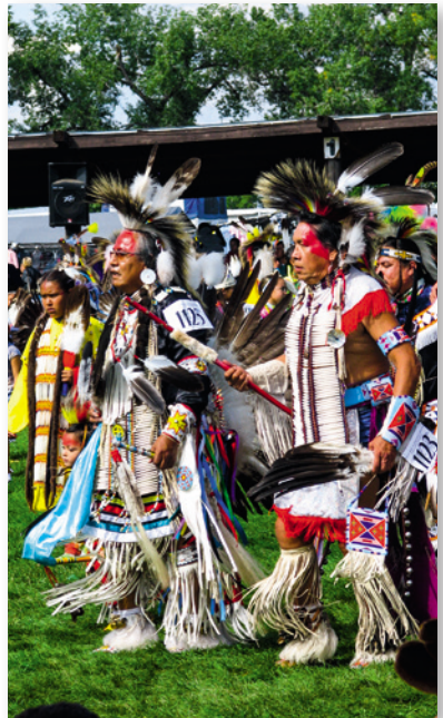
„Warriors of the Plains“

Die Tatsache, dass in Hollywood-Produktionen oder in der Abenteuerliteratur eines Karl May immer wieder Stammesnamen wie Arapaho , Blackfoot , Cheyenne , Comanche , Crow , Kiowa , Mandan oder Lakota (Sioux) auftauchen, mag daran liegen, dass deren Alltag besonders gut das Klischee vom freien, kämpferischen und – je nach Perspektive – grausamen oder „edlen Wilden“ widerspiegelte. Immerhin waren es die Lakota gewesen, die sich unter Führern wie Crazy Horse oder Sitting Bull neben den Comanches und Apaches am heftigsten gegen die weiße Landnahme gewehrt hatten.