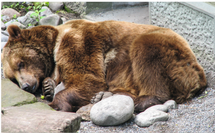
Der Bär macht's vor: Ruhe bewahren!

Die Parkverwaltungen propagieren die Einhaltung gewisser Grundregeln für Besucher, besonders für Camper. Bei einer Begegnung mit „Meister Petz“ lautet die Devise „Ruhe bewahren“. Panisches Wegrennen würde lediglich den Jagdinstinkt wecken. Sichere Verhaltensregeln gibt es angesichts der