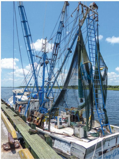
An der Pazifikküste ist der Fischfang immer noch von großer Bedeutung

Mit Tausenden von Küstenkilometern sind die USA eine der wichtigsten Fischfangnationen der Welt mit drei klassischen Fanggebiete: Atlantik, Golfküste und Pazifik. In Kalifornien, Oregon und Washington sowie Alaska ist der Fang von Lachs, Garnelen, Hummer und Krabben sowie die Austernzucht vorherrschend.