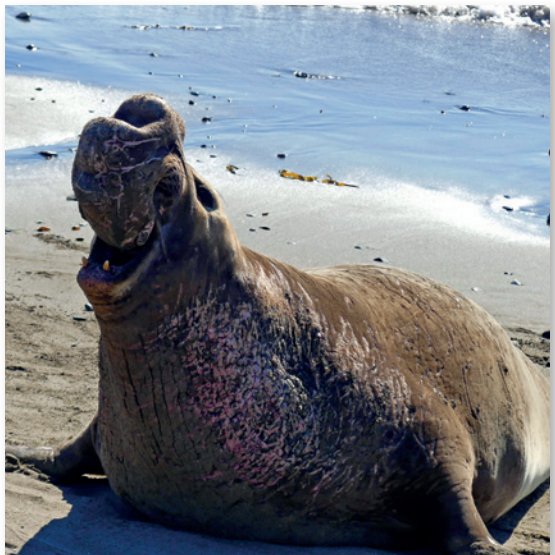
Der See-Elefant gehört zu den größten Robben der Welt

Zu den im Pazifik vorkommenden Robben-Arten gehören die Pelzrobbe ( Northern Fur Seal ), der Nördliche See-Elefant ( Northern Elephant Seal ) und der Seehund ( Harbor Seal ). Seelöwen-Arten sind der Stellersche Seelöwe ( Northern Sea Lion ) und der kalifornische Seelöwe ( California Sea Lion ). Man unterscheidet die Tiere danach, ob sie Ohren haben ( Fur Seal, Northern und California Sea Lion ) oder nicht ( Harbor Seal und Northern Elephant Seal ).