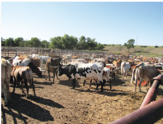
Die Viehzucht spielt bis heute eine wichtige Rolle

Noch mehr Arbeitsplätze wurden allerdings in der Verwaltung und im Dienstleistungssektor geschaffen. Der Tourismus entwickelte sich von bescheidenen Anfängen im 19. Jh., auch dank des infrastrukturellen Ausbaus der Nationalparks in den 1930er-Jahren, in einigen Staaten zum prosperierendsten Wirtschaftszweig überhaupt.