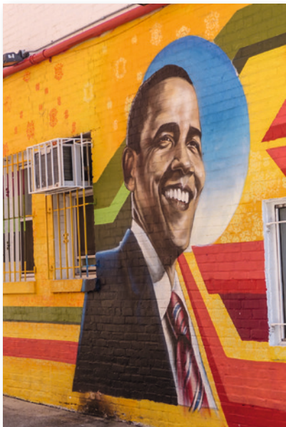
Der erste afroamerikanische Präsident der USA: Barack Obama (2009–2017)