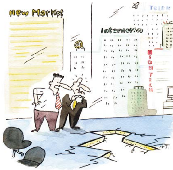
Illustration: Dirk Meissner, Der Börsenführerschein, S. 22