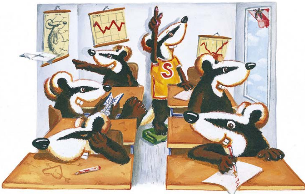
Illustration: Henning Löhlein, Der Börsenführerschein, S. 24

Auch bei der Dividendenrendite muss sich der SDAX nicht verstecken. Bei etlichen Unternehmen liegt die Dividendenrendite über 4 %. Darunter befinden sich etliche „Marathonaktien“, die langfristig für hohe Kursgewinne sorgen und das Anlegerherz in doppeltem Sinn höher schlagen lassen.