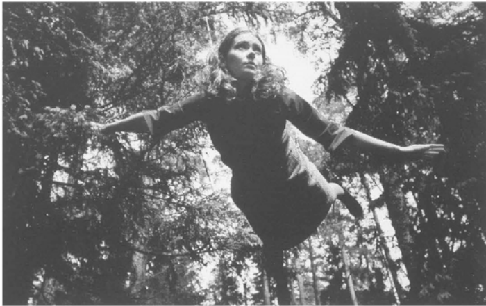
Abb. 5: Ausschnitt aus Eija-Liisa Ahtila: The House .

Dieses Paradox, so Silverman, »widersteht allen rationalisierenden Gesten«. Vielleicht kann Kunst das erreichen, was Gedanken und ihre Niederschrift in Kritik, Theorie und Philosophie nicht vermögen. Ich behaupte, dass Ahtilas Installation diesem Bemühen Gestalt gibt. Uns in eine räumliche Beziehung und affektive Empfänglichkeit gegenüber einer Frau zu versetzen, die wie eine Patientin mit Wahnvorstellungen spricht, die sich manchmal wie ein allmächtiges Kind benimmt, und die uns ein ausdrucksloses Gesicht zeigt, auf das wir Affekte zu projizieren eingeladen sind, ist ihr kreativer Beitrag, um das Heideggersche Paradox zu lösen.