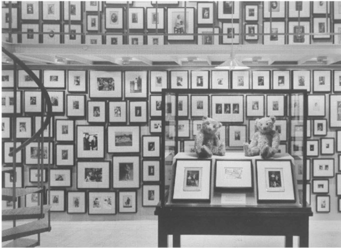
Abb. 1: Ydessa Hendeles: Partners (The Teddy Bear Project) . Installation, Haus der Kunst, München 2002, courtesy of the Ydessa Hendeles Art Foundation.

lung war ein hervorragendes Beispiel für dieses Prinzip und ihre besondere Verwendung von Objekten, die wir »Kunst« nennen, demonstriert den Wert einer Perspektive, die den Affekt ins Zentrum rückt.