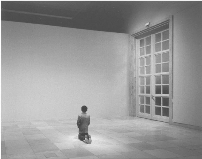
Abb. 2: Maurizio Cattelan: Him . 2001, Installation, Haus der Kunst, München.

Dieses Beispiel zeigt die Nützlichkeit des Affekts als übergreifendes Konzept. Das bedeutet nicht, dass alles im Sinne einer unreflektierten Vereinheitlichung miteinander verschmolzen wird. Im Gegenteil: Wie die Aufsätze in diesem Band, jeder auf seine Art und Weise, demonstrieren, eröffnet der Affektbegriff eine Vielzahl an Untersuchungsmöglichkeiten. Sicherlich ist es so, dass viele Artefakte, die wir als künstlerische Werke begreifen, sich dazu eignen als »Affektbilder« beschrieben zu werden. Jedoch sei beispielhaft für das nicht-vereinheitlichende Potential des Affektbegriffs darauf hingewiesen, dass das Deleuzsche Affektbild keineswegs an das menschliche – oder digital: das »posthumane« Gesicht – gebunden sein muss. 10 Vielmehr bezieht sich Deleuze auf Bilder, die weder vermittelnd zwischen BetrachterIn und Vorstellung stehen (er verwendet bezeichnenderweise das Verb »übersetzen«), noch zu einer Handlung führen, sondern ein Verschmelzen von Subjekt und Objekt auszulösen vermögen.