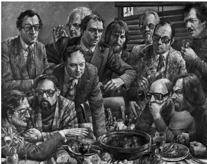
Abb. 5: Harald Duwe, Abendmahl, 1978 (Tutzing, Evangelische Akademie)

d. h. als gedachte Wirklichkeit zu formulieren und normativ zu behaupten. Vielmehr fragt sie danach, wie die Wirklichkeit des christlichen Glaubens sich im Leben der Menschen auswirkt, wie sie im Leben der Menschen selbst Wirklichkeit ist und wird. In diesem Sinne kann man sagen: Pastoraltheologie ist Reflexion wirklicher Wirklichkeit.