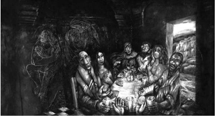
Abb. 6: Sieger Köder, Das Mahl mit den Sündern, 1973 (Palestrina/Latium, Villa San Pastore)

Diese sieben Personen sind die „Sünder“, die Abgesonderten, die an den Rand der Gesellschaft gedrängt werden. Zu sehen ist aber auch noch eine achte Person: Jesus, dessen Hände aus dem unteren Bildrand ragen und der mit diesen Sündern Mahl hält. Dass seine Hände Brot darreichen und einen Becher Wein umfassen, lässt nun doch an ein „Abendmahl“ denken. Entgegen den klassischen Abendmahlsdarstellungen, bei denen die Betrachtenden frontal auf die zentrale Figur Jesus und die um ihn gruppierten Jünger schauen, dreht Köder hier die Blickrichtung um. Aus der Perspektive Jesu blicken die Betrachtenden auf die Personen, die mit ihm die Tischgemeinschaft bilden. Die konventionelle Theologie vollzieht sich zum Großteil im Modus der frontalen Blickrichtung. Sie nimmt direkten Zugriff auf ihre Erkenntnisobjekte, so auch auf die Gestalt Jesus Christus, und weist diesen eine bestimmte Bedeutung zu. Die Pastoraltheologie unterscheidet sich davon. Sie richtet ihren Blick zunächst auf die Menschen und deren Lebenswirklichkeiten. Dieser Blick auf die Menschen lässt etwas an der Gestalt Jesus Christus erkennen, was beim direkten, unmittelbaren Zugriff auf die Inhalte des Glaubens nicht erkannt werden kann. Die Pastoraltheologie findet in den Menschen eine Quelle theologischer Erkenntnis.