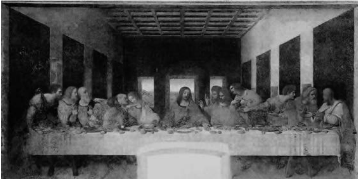
Abb. 2: Leonardo da Vinci, Das letzte Abendmahl, 1495–1497 (Mailand, Santa Maria delle Grazie, Refektorium)

Leonardo da Vincis (1452–1519) klassische Darstellung des Abendmahles kann man als Normalfall eines Kunstwerkes mit christlichem Motiv deuten: Ein Künstler schafft ein Bild und führt damit einen bestimmten Inhalt des christlichen Glaubens den Zeitgenossen wie auch kommenden Generationen vor Augen. Der Künstler trägt mit dem Kunstwerk dazu bei, dass der dargestellte Glaubensinhalt den Betrachtenden vermittelt bzw. dass deren Wissen um diesen Inhalt bewahrt wird. Über lange Zeit hinweg erwies sich die Präsentation von Glaubensinhalten in dieser Form aus einem praktischen Grund als notwendig: Eine des Lesens weitgehend unkundige Bevölkerung war, um eine Vorstellung von einem Glaubensinhalt zu bekommen, auf dessen bildliche Darstellung angewiesen. Die Vergegenwärtigung der Glaubensinhalte in Bildern war also eine den Betrachtenden angemessene Form ihrer Vermittlung. So leistet da Vincis Abendmahl etwas, was auch die Pastoraltheologie als ihre genuine Aufga-