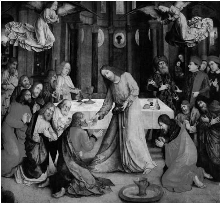
Abb. 4: Justus van Gent, Die Einsetzung des Abendmahls, 1473/1474 (Urbino, Palazzo Ducale)

Justus van Gent (ca. 1410 – ca. 1480) zeichnet einem verbreiteten ikonographischen Typus folgend das Abendmahl als Einsetzung der Eucharistie. Er lässt die Szene des Abendmahls im Altarraum einer Kirche spielen. Natürlich weiß man: Was immer damals vor 2000 Jahren in einem Raum im Obergeschoß eines Hauses in Jerusalem (vgl. Mk 14,12–16) geschehen sein mag – es war gewiss nicht das, was man auf dem Bild sieht. Den Raum umgaben sicher keine Stuckmarmorsäulen; es gab sicher keinen Messkelch, keine Patene und keine Ministranten; die Apostel knieten sicher nicht vor Jesus; und Jesus steckte den Aposteln sicher keine Hostien in den Mund. Mit dem Bild verfolgen also der Künstler und seine Auftraggeber ein anderes Inte-