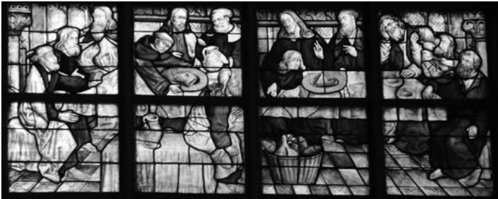
Abb. 3: Westfälisches Abendmahl (unbekannter Künstler), um 1500 (Soest, Wiesenkirche)

Die Darstellung eines unbekanntes Künstlers aus der Wiesenkirche in Soest zeigt das Abendmahlsgeschehen in einem für ihre Betrachter vertrauten westfälischen Ambiente: Auf dem Tisch finden sich Schweinskopf und Schinken; zu trinken gibt es Bier in Krügen; im Weidenkorb unter dem Tisch lagern dunkles Brot und weitere Vorräte. Der Künstler will also den Gläubigen einen Inhalt des christlichen Glaubens nahebringen, indem er eine Nähe herstellt zwischen dem Bericht über das „letzte Abendmahl“ Jesu und der Alltagswelt der Betrachter. In ähnlicher Weise gehört es zur eigenen Art der Pastoraltheologie, die Menschen spüren zu lassen, dass die Inhalte des christlichen Glaubens zu ihrer vertrauten Alltagswelt gehören oder für ihr alltägliches Leben von Bedeutung sind. Die Pastoraltheologie muss darum wissen, wie Menschen ihre Wirklichkeiten erfahren; sie muss verstehen, was die Menschen, wenn sie über ihre Wirklichkeiten sprechen, von sich kundtun; sie muss wahrnehmen, wie für die Menschen alltägliche Erfahrungen und Inhalte des Glaubens zusammengehören – oder auch nicht mehr zusammenpassen. Die entscheidende Voraussetzung dafür ist, dass Pastoraltheologinnen und Pastoraltheologen selber mit der Alltagswelt der Menschen vertraut und in dieser verwurzelt sind.