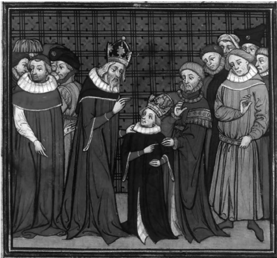
Abb. 1.5: Karl der III., Ausschnitt aus der Herrschergalerie im Kaisersaal des Hauses zum Römer im Frankfurter Rathaus, Carl Trost, ca. 1838–1858