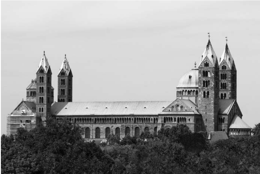
Abb. 2.3: Südseite des Kaiser- und Mariendoms zu Speyer