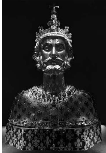
Abb. 1.4: Die Karlsbüste (nach 1349, Aachener Domschatzkammer) enthält der Überlieferung zufolge die Schädeldecke des Herrschers

Karl der Große herrschte über das heutige Frankreich, Norditalien und Westdeutschland bis zur Elbe. Karls Reich umfasste die heutigen Staaten Frankreich und Belgien, die Niederlande, Luxemburg, Nordspanien bis zum Ebro, fast die ganze italienische Halbinsel, in Deutschland aber eigentlich nicht mehr als das Gebiet der gegenwärtigen Bundesrepublik [vor der Wiedervereinigung]. 63 Die Grenzen sicherte er durch Marken, d. h. Markgrafen verwalteten in seinem Auftrag das Land. 64 Der älteste Sohn Königs Pippins kleidete sich gern in altfränkischer Tracht, von der es hieß, er habe auf sie in seinem Leben nur zweimal verzichtet 65 und sprach moselfränkisch. Sein Lieblingsbuch war Augustinus „Gottesstaat“ und da vor allem das Kapitel über den christlichen Fürsten. Karl verstand sich in seinem Herrscheramt als Führer und Verteidiger des ‚Gottesstaates‘ auf Erden ... 66 Wie bei Augustinus durchdringen sich auch bei Karl weltlicher und kirchlicher Staat.