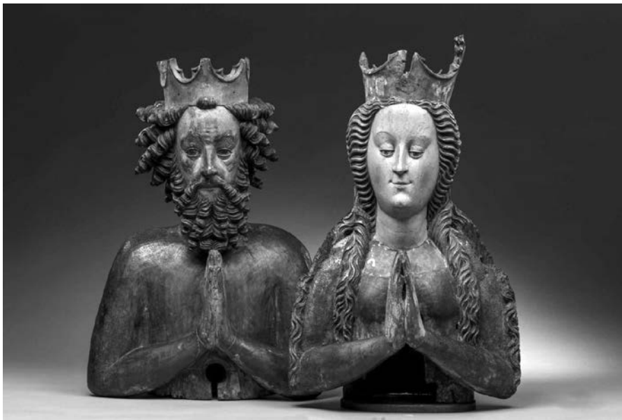
Abb. 2.2: Reliquienbüsten Heinrichs II. und Kunigundes, um 1430/40

Als einziger deutscher Kaiser wurde Heinrich II. (und seine Frau Kunigunde) 1146 von Papst Eugen III. heiliggesprochen, obwohl er 1003 ein Bündnis mit den heidnischen Redariern und Liutizen gegen den christlichen Polenherzog Bolesław