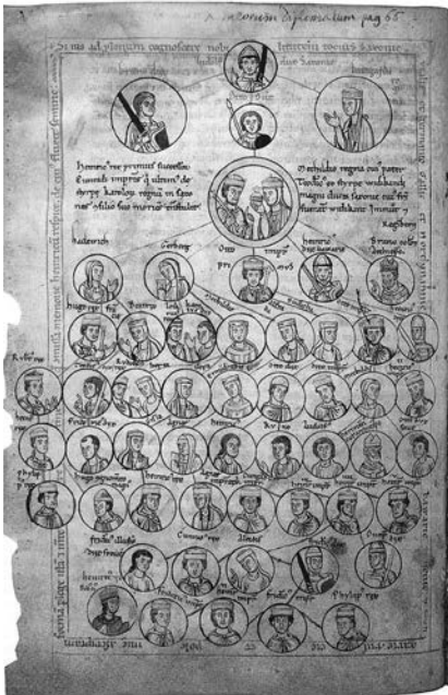
Abb. 1.2: Stammtafel der Ottonen mit Heinrich I. und Mathilda oben mittig in doppelter Umrahmung, Chronik St. Pantaleonis, 2. Hälfte des 12. Jh.

Wenn auch die Geschichte Deutschlands mit Heinrich I. und Otto I. beginnt, also mit dem Jahr 919 bzw. 962, bedeutet dies keineswegs, dass schon ein Bewusstsein dafür vorhanden war „Deutscher“ zu sein. Ein Bewusstsein oder Empfinden, einer „deutschen Nation“ anzugehören, gab es auch danach nur rudimentär und vereinzelt – z. B. bei Walther von der Vogelweide (1170–1230), entwickelte sich jedoch klarer seit dem 16. Jahrhundert (die Humanisten Conrad Celtis und Ulrich von Hutten spielten hier eine große Rolle) und bekam einen deutlichen Schub im 19. Jahrhundert. Unabhängig davon schufen die Ottonen, Salier und Staufer das politische und kulturelle Fundament, auf dem sich mit der Zeit ein deutsches Nationalbewusstsein entwickeln konnte.