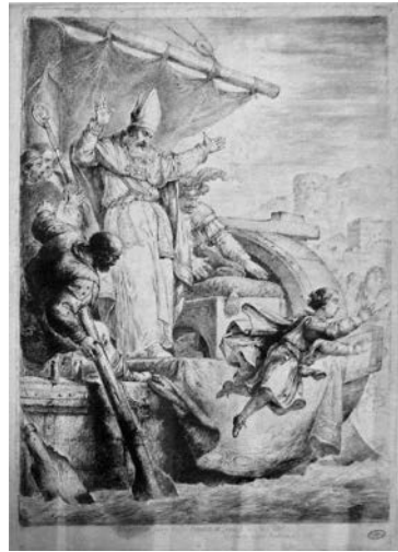
Abb. 2.5: Der Sprung des Kaisers Heinrich vom Boot seiner Entführer, Radierung von 1781

In einer traumatischen Entführungsaktion brachte Anno II. Heinrich in seine Gewalt. Als sich die königliche Familie im April 1062 auf der Rheininsel Kaiserswerth aufhielt, lud Anno den zwölfjährigen Jungen dazu ein, sein prächtig geschmücktes Schiff zu besichtigen. An Bord wurde er sogleich umzingelt und das