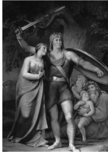
Abb. 1.1: Arminius/Hermann und Thusnelda, Johann Heinrich Tischbein, 1822

Das Kapitel behandelt den Beginn der deutschen Geschichte. Historiker fanden Wurzeln bei den alten Germanen, sahen Arminius als Ahnherren und in den Frankenkönigen Chlodwig und Karl dem Großen Vorläufer des zukünftigen deutschen Reichs. In der Teilung des Frankenreichs in das westfränkische und ostfränkische Reich lassen sich die ersten Ansätze einer eigenständigen deutschen (und französischen) Geschichte erkennen. Mit der Krönung des Sachsenherzogs Heinrich I. zum ostfränkischen König im Jahr 919 beginnt die deutsche Geschichte, wobei Weitgehend Einigkeit besteht ..., dass es ein punktuelles Anfangsdatum gar nicht geben kann, weil der Übergang vom karolingischen Teilreich zum mittelalterlichen Reich der Deutschen ein gestreckter Prozess war. 1 Gleichwohl kann Heinrich I. als der erste König und sein Sohn Otto I. als der erste Kaiser der Deutschen gelten, wobei die Kaiser eine besondere ‚dignitas‘, eine protokollarische Vorrangstellung unter den Königen des Abendlandes ... für sich beanspruchten ... 2