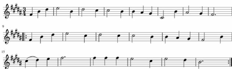
Notenbeispiel 1: Notenzeile im Pribula-Album, S. 38

Zuordnungsschwierigkeiten ergaben sich außerdem im Falle von fragmentarischen Notenaufzeichnungen. Beispielsweise zierte die Melodie des polnischen Liedes »Czas do domu, czas« (»Es ist Zeit, nach Hause zu gehen«) den gesamten Hintergrund eines Konzertprogramms im Tymiński-Album (siehe Abb. 34, S. 323). 50 Nicht zu identifizieren waren Noten in Form eines Dreiecks im Tymiński-Album 51 sowie zwei Notenzeilen im Album von Pribula 52 :