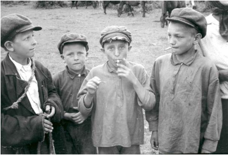
Russland, Kinder rauchend.

weder als Verwaiste oder als Kinder, die ein Zubrot für ihre Familienmitglieder zu Hause verdienten. 51 Bei all dem fällt auf, dass die übernommenen Tätigkeiten und Rollen geschlechtsspezifisch waren: Mädchen antizipierten frauentypische Rollen, während Jungen eher körperliche Arbeiten übernahmen und sich den Habitus der erwachsenen Männer zulegten.