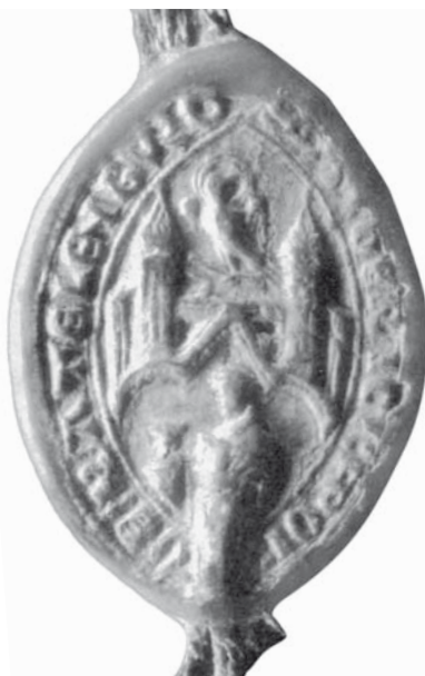
Siegel des Propstes (NLAH, Cal. Or. 100 Katlenburg, s. Winzer, Lagerbuch S. 188)

Katlenburg erhaltenen Privilegs bereits 1150/1154 zur Legitimierung seines Rechtsanspruchs zum Ausdruck gebracht hatte. 8