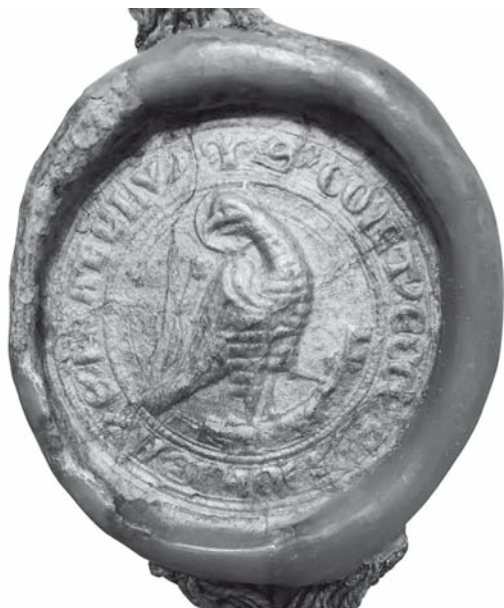
Siegel des Konvents (NLAH, Cal. Or. 100 Katlenburg Nr. 62)