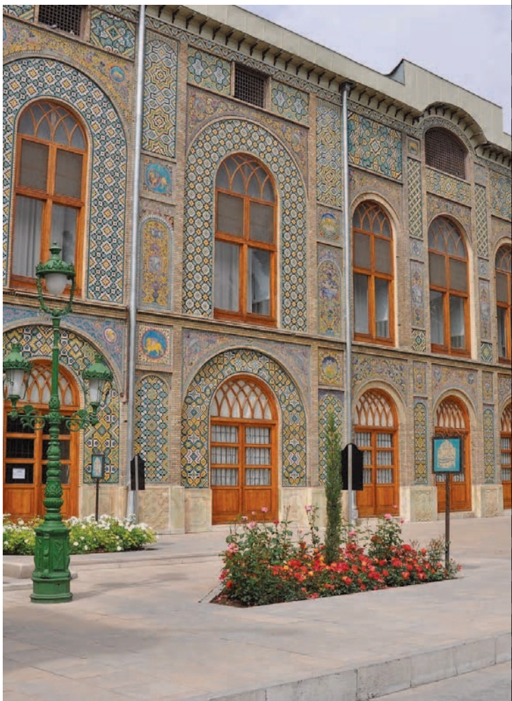
Golestān-Palast in Teheran