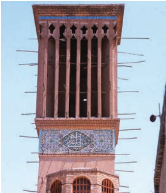
Windturm in Kermān

Andere umgangssprachliche Formen sind zwar in schriftlicher Form eher ungebrauchlich, werden aber in diesem Buch dennoch mitaufgeführt und ebenfalls in persischer Schrift wiedergegeben. Allerdings lassen sich nicht alle Ausspracheunterschiede zwischen der Schrift- und der Umgangssprache mit den persischen Buchstaben nachbilden. Bleibt bei unterschiedlich gesprochenen Varianten die persische Schreibung gleich, wird das entsprechende Wort in der Originalschriftzeile auch nur einmal aufgeführt (d. h. in der Lautschrift steht dann ein Schrägstrich, in der persischen Schrift aber nicht).