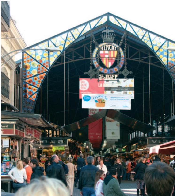
Mercat Sant Josep (La Boqueria) in Barcelona