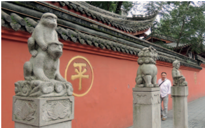
Ping – Friede! Am Wenshu-Tempel in Chengdu

In der VR China wird seit Jahrzehnten die Aussprache der Schriftzeichen in einem lateinischen Schreibsystem wiedergegeben, dem Hànyǔ pīnyīn 汉语拼音. Es ist die einzige von der UN offiziell anerkannte Transkription der Aussprache des Hochchinesischen (es wird nicht auf Taiwan und in Hong Kong benutzt).