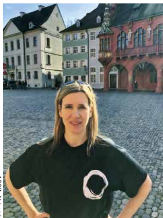
1037b