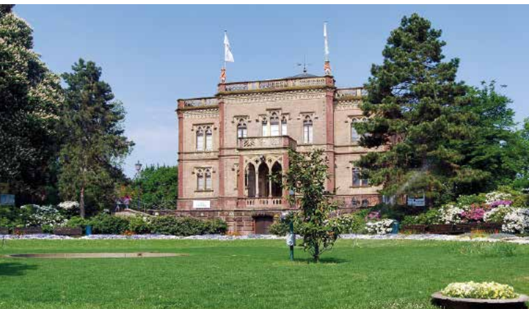
067fr Abb.: KT

Über die Rathausgasse, einem der vielen Shoppingsträßchen der Innen-