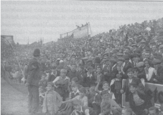
(Ohne Hooligans und Zäune: Ein Polizist gegenüber der Menge im Spiel Brentford-Huddersfield im Sept. 1935; aus Bausenwein, 1995, S. 327)

Im Gegensatz zum heutigen Hooliganismus waren die damaligen Aggressionen weniger gegen die gegnerischen Vereinsanhänger gerichtet, vielmehr hatten sie mit den konkreten Umständen des Spieles zu tun, wie zum Beispiel wenn die Zuschauer unzufrieden mit der Schiedsrichterleistung waren oder über das unfaire Spiel der gegnerischen Mannschaft oder über das überfüllte Stadion. So richtete sich die Gewalt eher gegen den Schiedsrichter oder gegen die Spieler oder gegen andere Fangruppen, was, mal abgesehen von den Derbys, auch damit zusammenhängt, dass zu den Auswärtsspielen wenig Fans mitreisten, einfach weil die (finanziellen) Möglichkeiten sehr beschränkt waren. 40