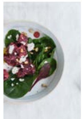
WAS BIETET DIE SAISON? S. 106