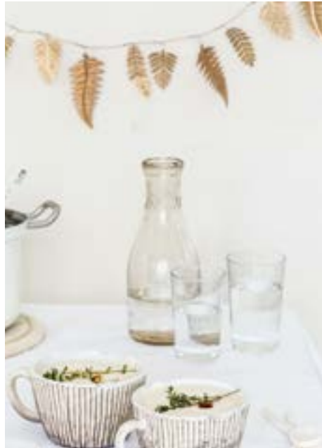
FESTLICHES IN DER WINTERZEIT S. 74