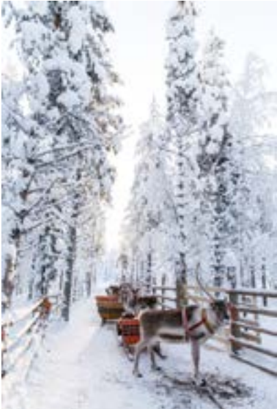
KÖSTLICHES WIE VOM WEIHNACHTSMARKT S. 54