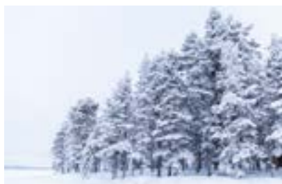
EIN NACHMITTAG AM KAMIN S. 134