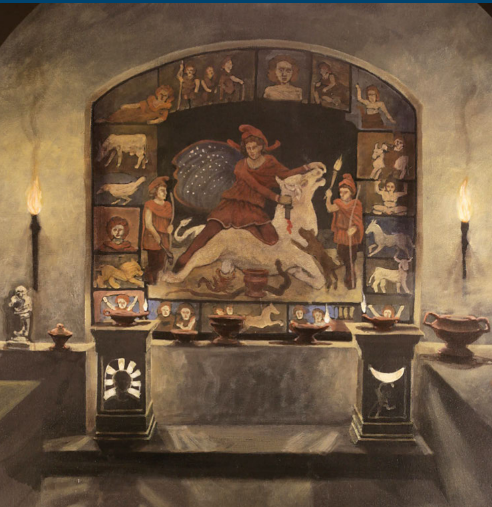
Virtuelle Rekonstruktion des Mithräums von Künzing.

von wissenschaftlicher Bedeutung nicht nur für die römische Geschichte Regensburgs selbst, sondern auch für die Archäologie der Römerzeit in Bayern insgesamt und darüber hinaus.