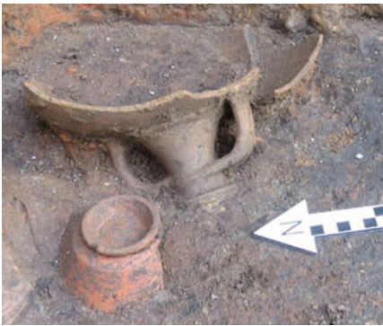
Li. o.: Trinkgeschirr für Kultgelage. Re. o.: Verstreuter Inhalt des im Vorraum umgestürzten Schanks oder Regals.