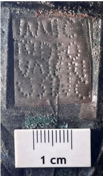
O.: Silberblech eines Votivschreins in situ.

Die Anhänger feierten ihre Gottesdienste, zu denen insbesondere auch