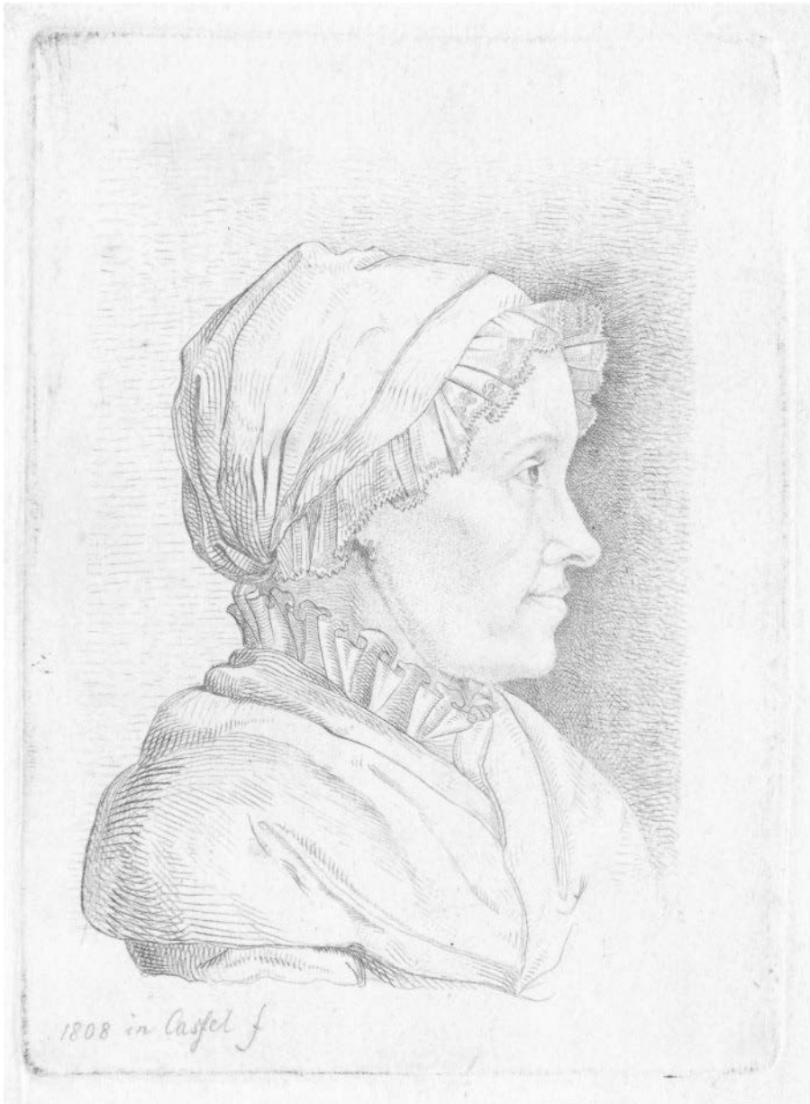
Dorothea Grimm geb. Zimmer. Radierung Ludwig Emil Grimms, 1808.