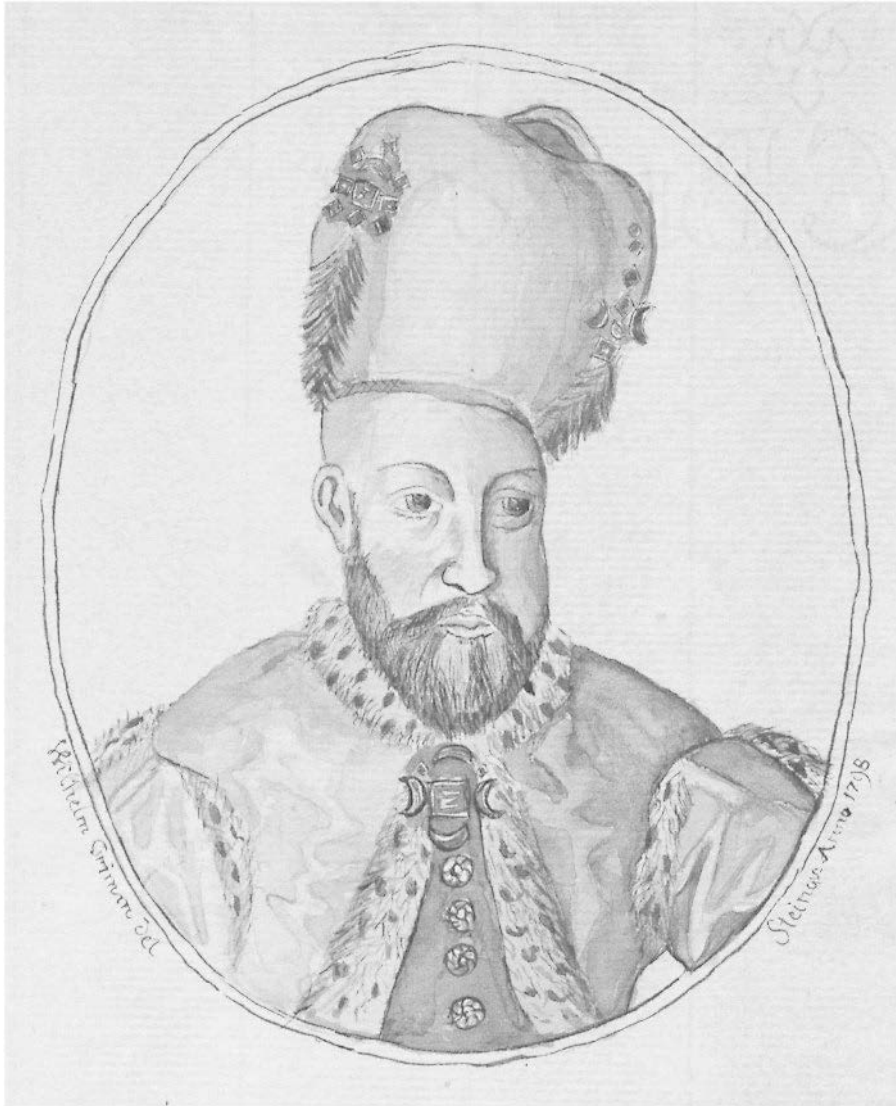
Sultan Ibrahim. Zeichnung Wilhelm Grimms nach einer Vorlage in Merians «Theatrum Europaeum», 1798.