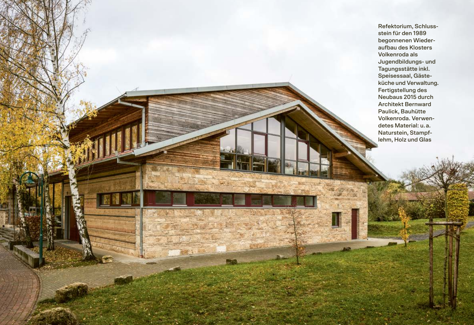
Refektorium, Schlussstein für den 1989 begonnenen Wiederaufbau des Klosters Volkenroda als Jugendbildungs- und Tagungsstätte inkl. Speisessaal, Gästeküche und Verwaltung. Fertigstellung des Neubaus 2015 durch Architekt Bernward Paulick, Bauhütte Volkenroda. Verwendetes Material: u. a. Naturstein, Stampflehm, Holz und Glas