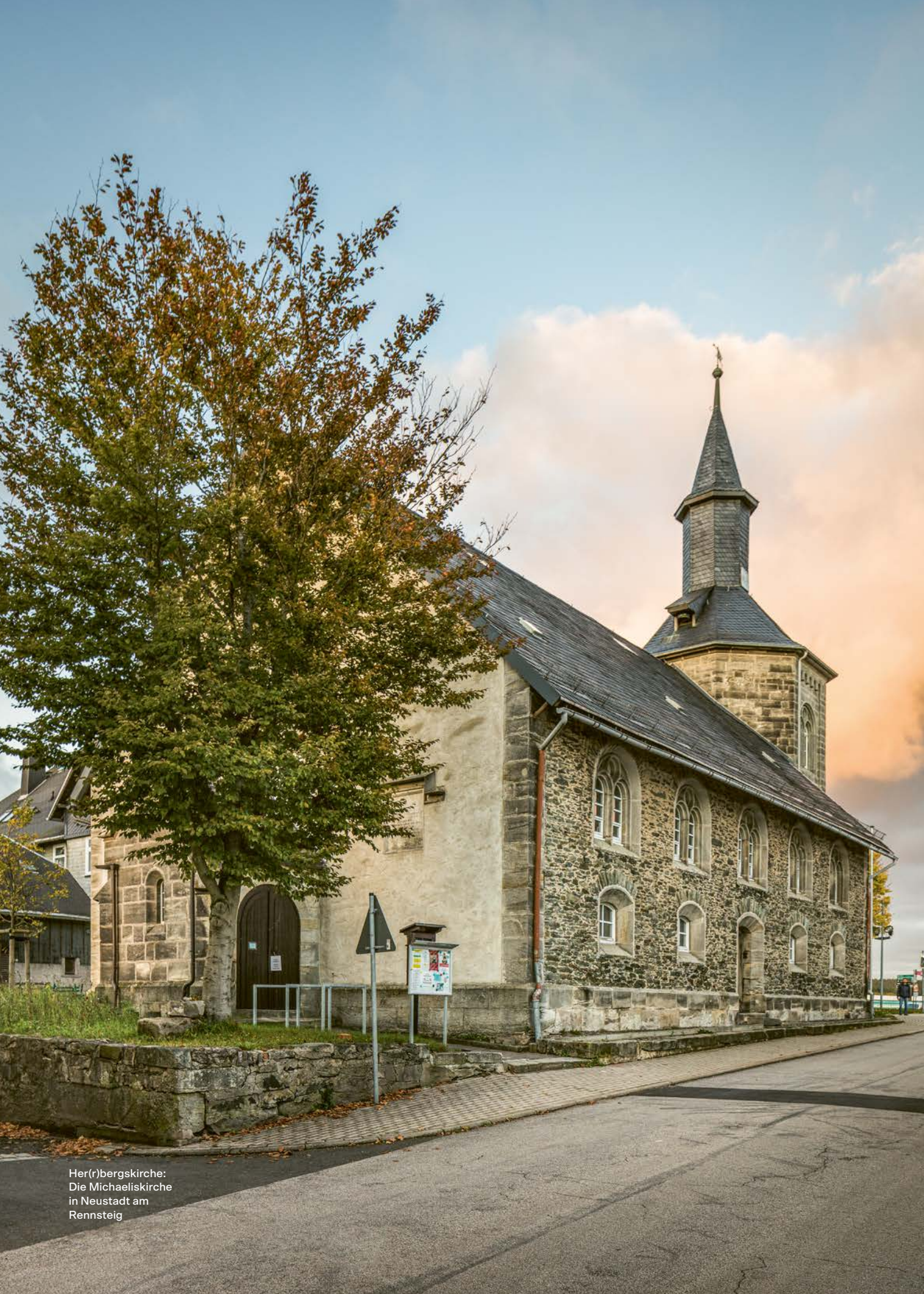
Her(r)bergskirche: Die Michaeliskirche in Neustadt am Rennsteig