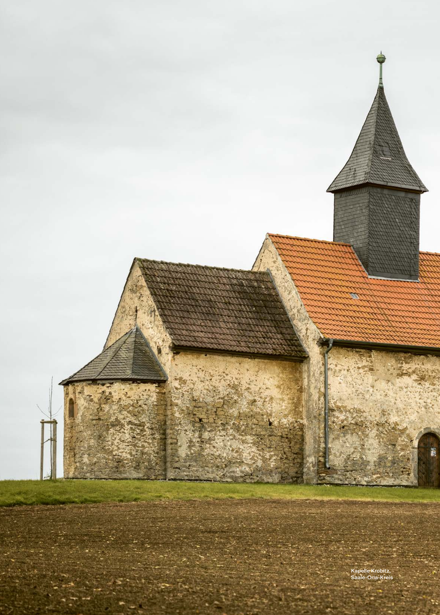
Kapelle Krobitz, Saale-Orla-Kreis