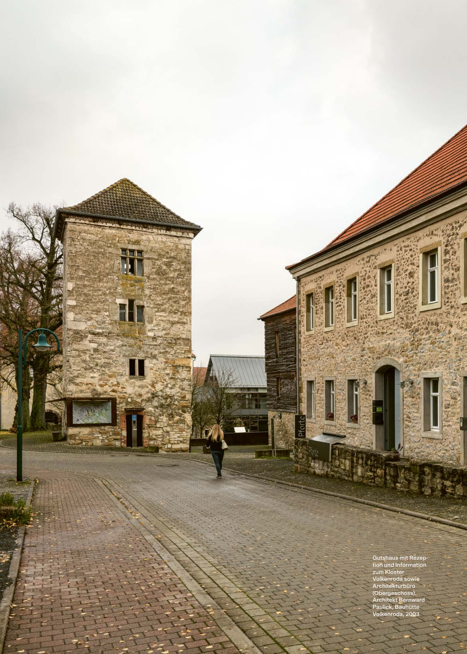
Gutshaus mit Rezeption und Information zum Kloster Volkenroda sowie Architekturbüro (Obergeschoss). Architekt Bernward Paulick, Bauhütte Volkenroda, 2003