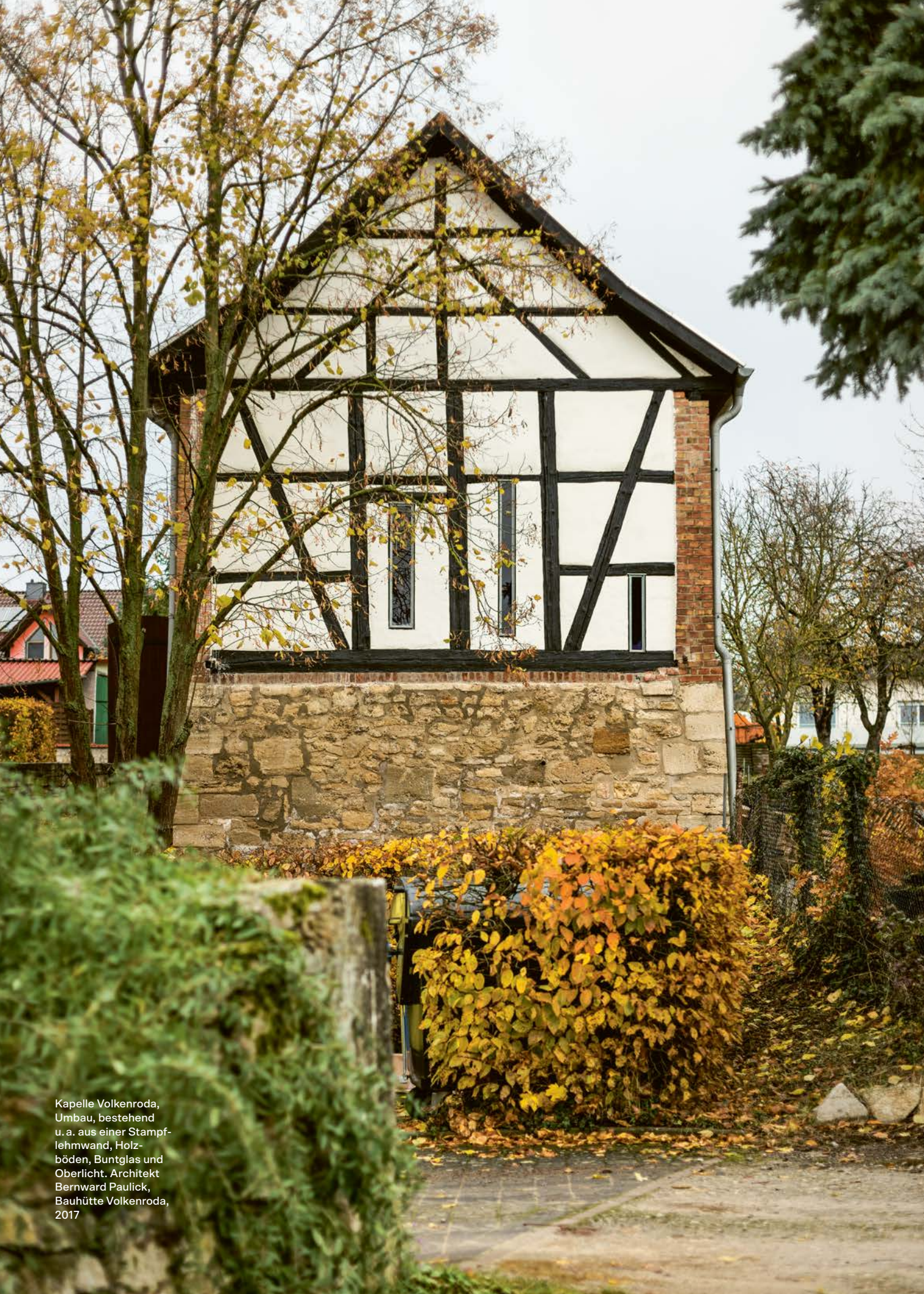
Kapelle Volkenroda, Umbau, bestehend u. a. aus einer Stampf- lehmwand, Holz- böden, Buntglas und Oberlicht. Architekt Bernward Paulick, Bauhütte Volkenroda, 2017