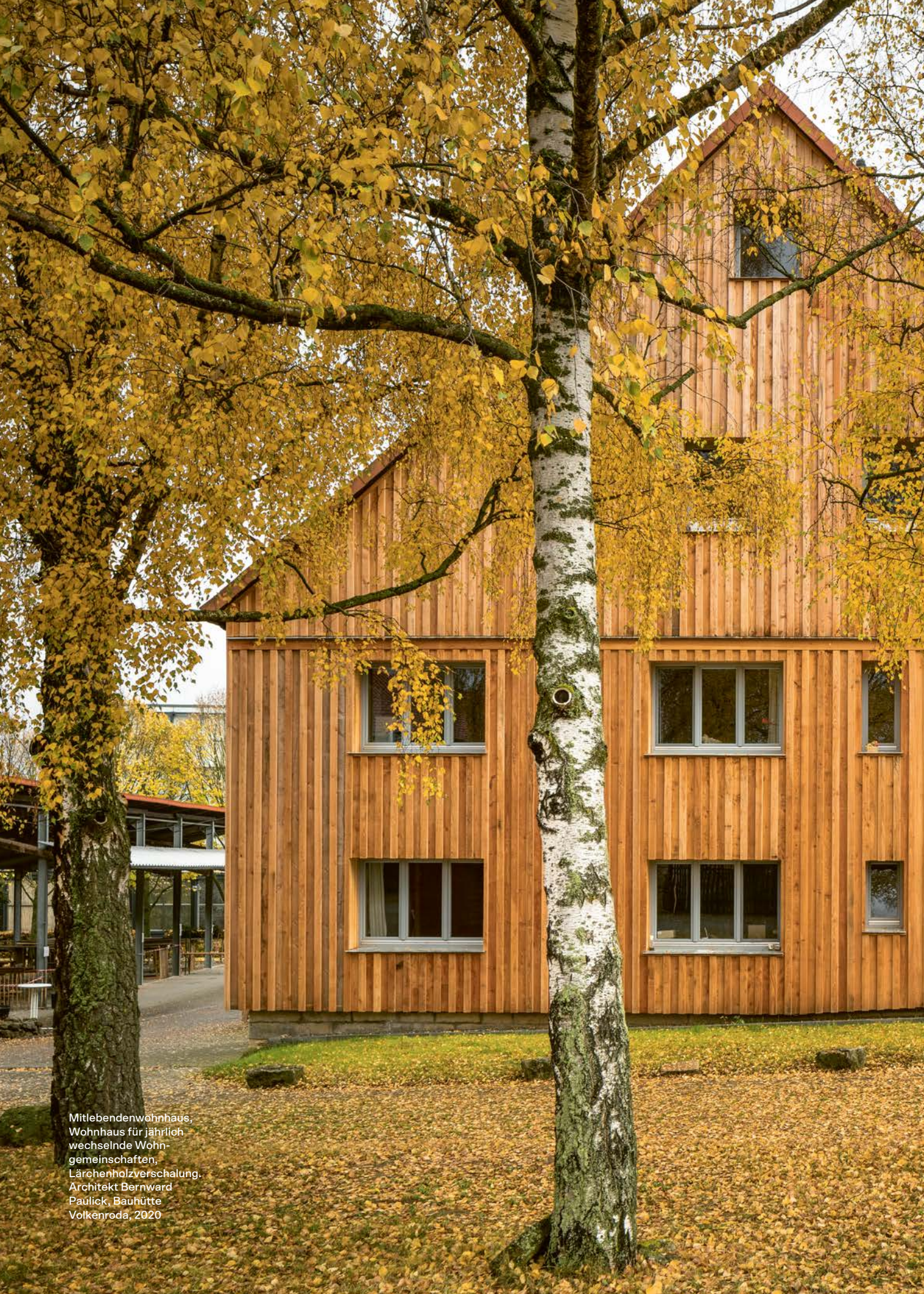
Mitlebendenwohnhaus, Wohnhaus für jährlich wechselnde Wohn- gemeinschaften, Lärchenholzverschalung. Architekt Bernward Paulick, Bauhütte Volkenroda, 2020