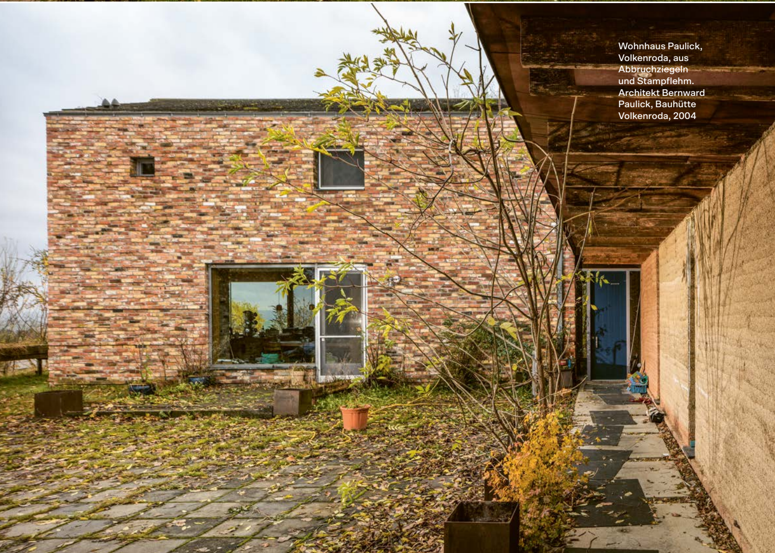
Wohnhaus Paulick, Volkenroda, aus Abbruchziegeln und Stampflehm. Architekt Bernward Paulick, Bauhütte Volkenroda, 2004