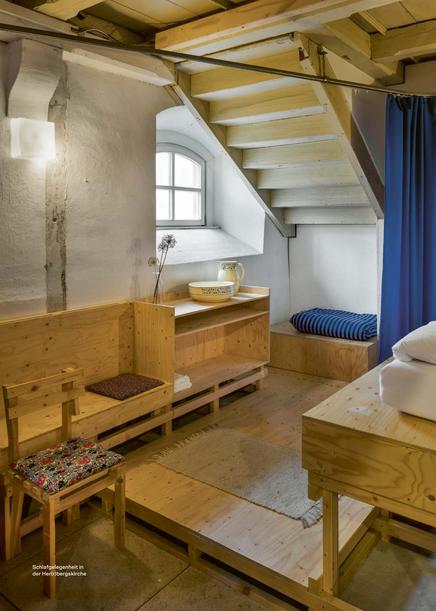
Schlafgelegenheit in der Her(r)bergkirche