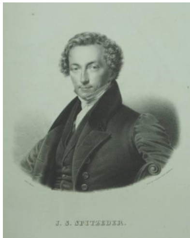
Abb. 5 Josef. Spitzeder 44

Dann, als der sterbende Iffland zu seinem Ersatz noch selber Ludwig Devrient nach Berlin gerufen hatte, wurde Schmelka in Breslau engagiert, um den großen Ludwig wenigstens in seinen komischen Rollen zu ersetzen – und jetzt war er auf besonderm Wunsch des Königs, dessen eigene trockene Weise an des Komikers trockenem Humor den größten Geschmack fand, »Königstädter« geworden. Aber die Blütezeit Schmelka's war schon vorüber, der »junge« Schmelka der Wiener war mit den Jahren alt und im Leben der finsterste Hypochonder geworden. Hausliche Sorgen drückten ihn nieder und für die Wiener Possen, die für sein spezielles Talent reichlich gegeben wurden, fehlte ihm das lebhaftes, dankbare, inspirierende Wiener Publikum. Für mich hatte die forcierte Komik des alten Mannes oft etwas Dämonisch-Tragisches. Man sah es ihm an, er fühlte sich in Berlin nicht heimisch, nicht behaglich. Machte er in den Proben oder im alltäglichen Leben einen Scherz, so hatte er stets ein Gesicht, als ob er beißen wolle. Er war der vortrefflichste Wirtin »Minna von Barnhelm«. Er spielte die Rolle ohne Maske und bot so die treueste Verkörperung jenes scharfgezeichneten Lustspielcharakters. Ich habe jenen Lessingschen Wirthund den Kollegen Schmelka in der Erinnerung nie voneinander zu trennen vermocht.