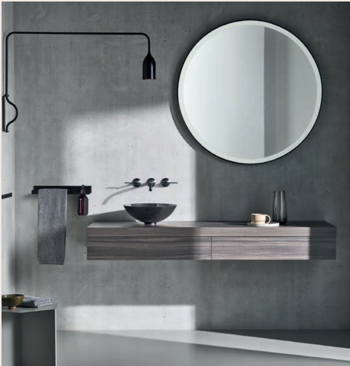
▲ Wohnlicher Purismus durch Auswahl hochwertiger Produkte. (Alape)

Der gegenläufige Trend, den wir in den heutigen hochwertigen Bädern erkennen, ist Purismus. Klare Formensprache, glatte Oberflächen und nüchternes Design sind die Eckpfeiler dieses Einrichtungsstils. Entsprechend fällt die Wahl der Materialien aus: Stahl/Email, Glas, Mineralwerkstoff, Metall und Beton bilden zeitlos-elegante Kombinationen. „Bitte kein Schnickschnack“ ist der häufigste Wunsch der Bauherren, die diesen Einrichtungsstil bevorzugen. Diese Bäder verfügen häufig über versteckten Stauraum in Möbelstücken, denn Aufgeräumtheit ist den Anhängern dieses Stils sehr wichtig. Diese sind nicht auf den ersten Blick als Möbel zu erkennen. Sie kommen wie auch Trennwände und andere Einrichtungsgegenstände ganz ohne sichtbare Scharniere oder Halterungen aus. Beim puristischen Einrichtungsstil wird in der Regel der Fokus auf die Wertigkeit der einzelnen Einrichtungsgegenstände und deren gezielte spezifische Wirkung gelegt. Gerade hier ist es wichtig, bei der Planung das Augenmerk auf ein stimmiges Gesamtkonzept des Raums zu legen. Damit auch bei aller Reduziertheit und Nüchternheit eine Wohlfühlatmosphäre entstehen kann.