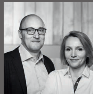
Adam Koch GmbH Co. KG – Forum für Bad und Wärme Martin Henrich