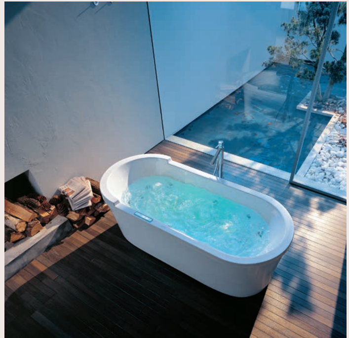
▲ Die Badewanne mit Whirlfunktion sorgt für ein Höchstmaß an Entspannung. (Duravit)

Das Bad hat heute neben der Funktion als Ort der Reinigung, wie bereits erwähnt, zusätzlich die Funktion als Ort, wo man sich vom Alltag erholen und seine Batterien wieder aufladen kann. In diesem Zusammenhang hat die altbewährte Badewanne eine Renaissance erfahren. Weil sich der moderne Mensch lieber in der Dusche als in der Wanne reinigt, wurde die Wanne in der Vergangenheit zunehmend bei der Modernisierung durch einen großzügigen und komfortablen Duschbereich ersetzt. Im Zuge des zunehmenden Wellnessgedankens ist sie allerdings wieder dabei, verlorenes Terrain