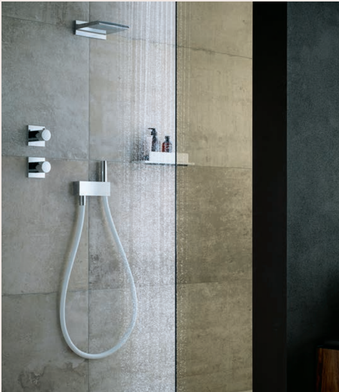
▲ Eine mit Gusschlauch ausgestattete Wellnessdusche für die täglichen belebenden Kaltwasser-Anwendungen im heimischen Badezimmer. (Keuco)