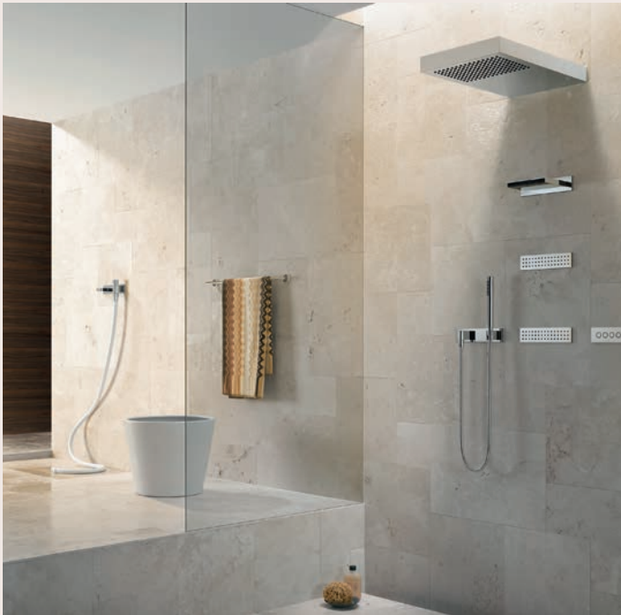
▲ Die Wellnessdusche sorgt für ein Duscherlebnis der Extraklasse. (Dornbracht)

eingebaute Sitzbank oder als Klappsitz, bietet zusätzlichen Komfort bei der Körperrasur, der Pediküre oder einfach beim entspannten Duschgang im Sitzen.