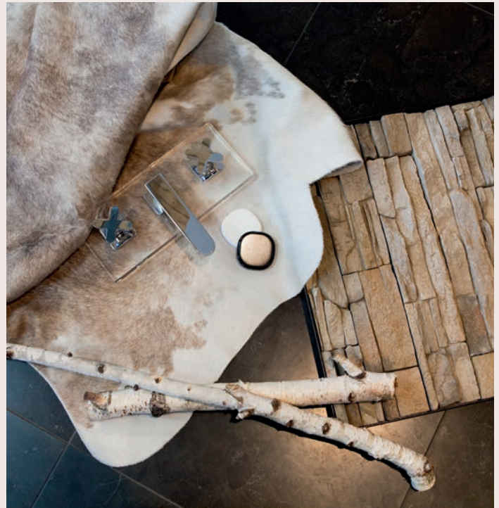
▲ Naturmaterialien im Bad liegen im Trend.

Natürliche Materialien, erdige Töne, warm-weiche Oberflächen: Der Trend, die Natur ins Bad zu holen, tritt immer häufiger in Erscheinung. Holz, Naturstein, Leder, Pflanzen und Kalkputz sind Elemente, die man immer häufiger auch im Bad findet. Wer sich gerne mit natürlichen Rohstoffen und Materialien umgibt, weiß, dass ihre Optik niemals identisch sein kann. So wird beispielsweise eine Natursteinplatte von einer natürlichen, aber ungleichmäßigen Mase-