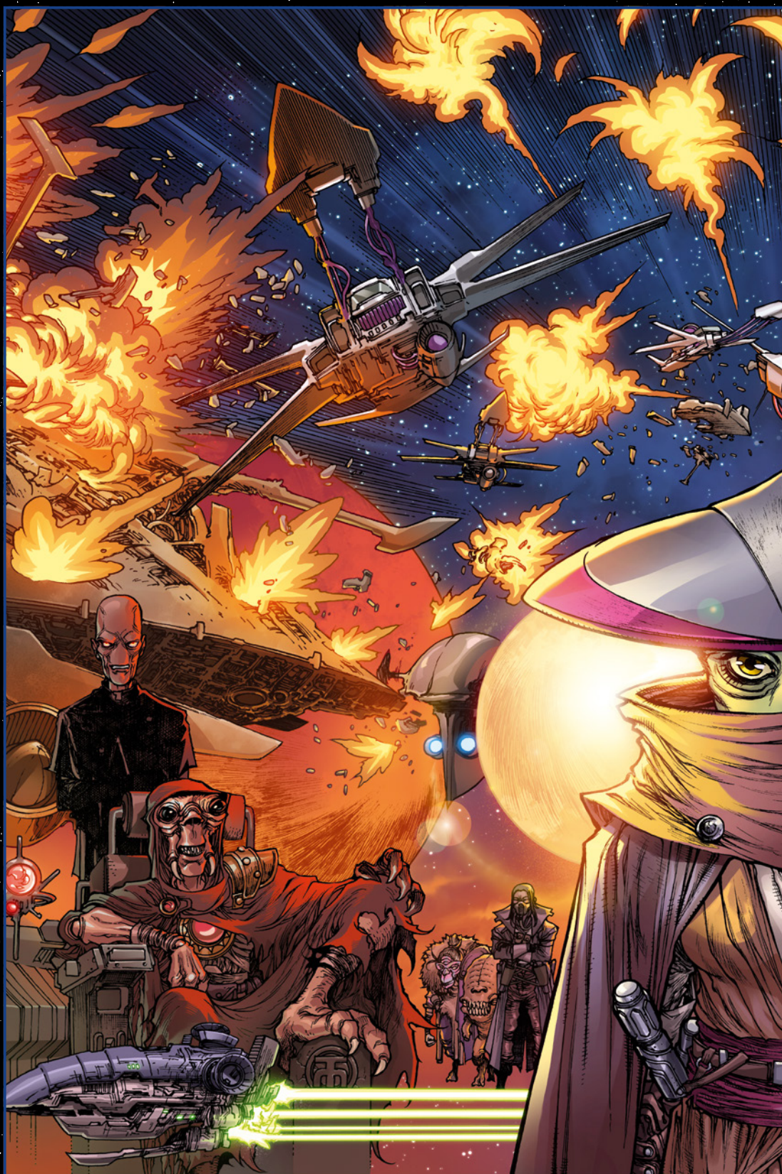
Cover von HARVEY TOLIBAO für Star Wars: The High Republic Adventures (Phase II) 5