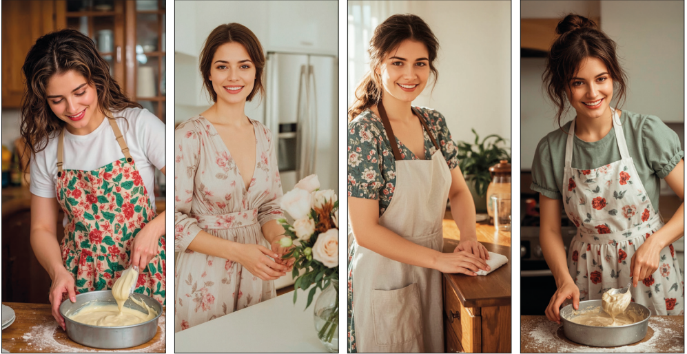
Tradwives auf Social Media.

Das ist leider nicht mal lustig, denn diese besonders auf TikTok zelebrierte Sehnsucht nach »traditionellen« Werten, Sicherheit und Geborgenheit nutzen rechte politische Parteien bewusst aus. In Deutschland macht das die AFD, die in ihrem Programm ihr Frauenbild genau in diesem Sinne formuliert hat: »Die Frau versorgt Kinder und Haushalt und kümmert sich um ihre pflegebedürftigen Eltern. Nach der Geburt der ersten Kinder tritt sie dafür beruflich zurück.« 3