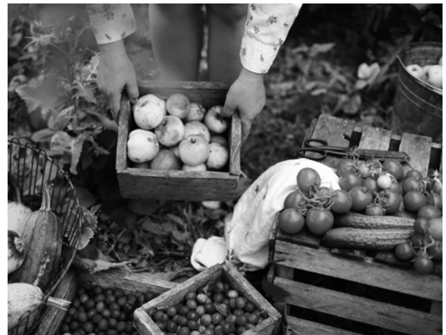
Bunte Vielfalt: die eigene Ernte

Eine wichtige Bedingung ist das Klima. Es macht einen Unterschied, ob es in einer Region viel regnet oder nicht, ob womöglich bereits im Oktober der Winter einsetzt (zum Beispiel im Harz oder im Erzgebirge) oder ob das Klima eher mild ist (zum Beispiel in der Oberrheinischen Tiefebene). Eine noch wichtigere Voraussetzung ist die Bodenfruchtbarkeit. Diese können Sie als Gärtner allerdings beeinflussen. Hier gilt: Je kleiner Ihr Grundstück ist, umso größer ist Ihr Einfluss durch Beigaben von Dünger, Mist und Kompost auf die Fruchtbarkeit Ihrer Erde, ja, auf das gezielte Wachstum jeder einzelnen Pflanze.