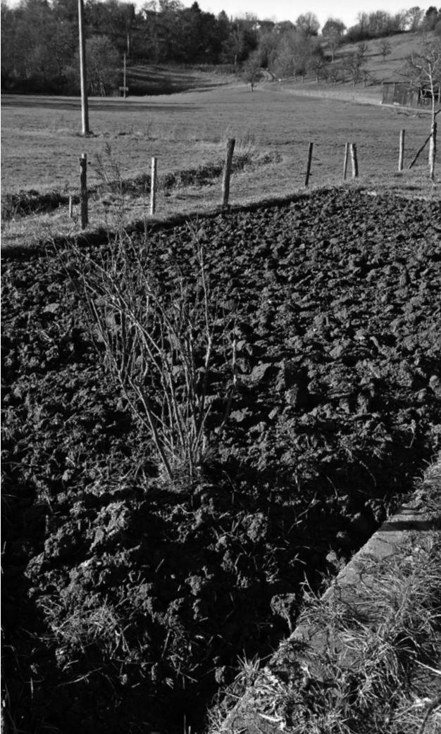
Ein perfekt geschortter Garten im Januar

garten strenge Regeln: Jeweils ein Beet enthielt eine Kultur. Das Beet musste 1 Meter 20 breit, der Weg zwischen den Beeten 30 Zentimeter breit sein. Die Beete waren blitzsauber, kein Pflanzenrestchen, kein Grashalm war zu sehen. Heute gelten andere Grundsätze, zum Beispiel der: