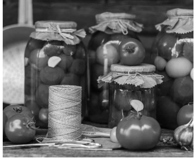
Gemüsekonserven am besten beschriften!

Ein Hektar ist eine Immobilie und ein Bauer ist sesshaft. Ein Stück Land kann nicht mitgenommen werden und ein Landwirt will (meist) nirgendwo anders sein als dort, wo sein Land ist, das für ihn der Grundstock, die Basis für sein Einkommen ist. Einer Betriebswirtschaftlerin, die in Frankfurt bei einer Bank einen guten Job hat, geht es vermutlich nicht viel