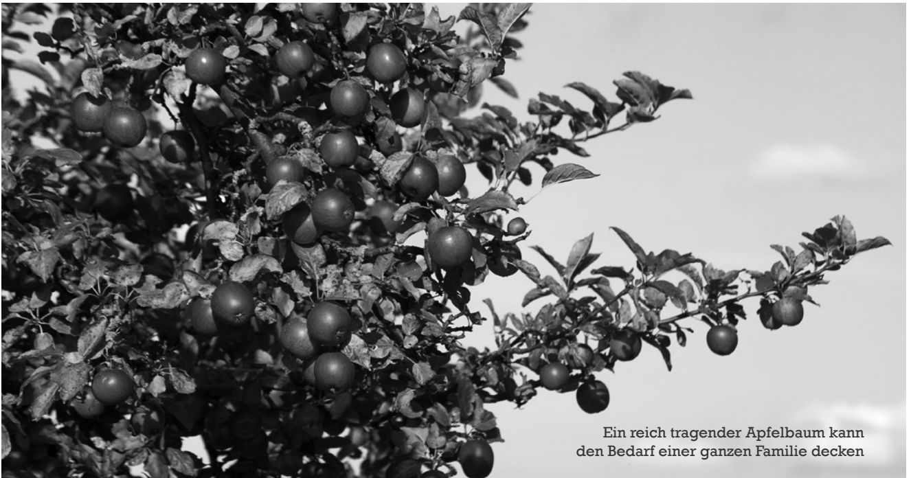
Ein reich tragender Apfelbaum kann den Bedarf einer ganzen Familie decken

Auf Ihrem einen Ar haben Sie ein Kartoffelbeet, einen Fleck, auf dem Ihre Tomaten stehen (am besten überdacht), ein großes Beet für Ihren Kohl, Beete für Salat, Zwiebeln und Kräuter, vielleicht auch Himbeersträucher. Am Rand, auf einem Rasenstück, das auch zum Garten gehört, stehen ein paar Halbstämme mit Äpfeln, Kirschen oder Birnen. Ist das Grundstück noch ein bisschen größer, haben Sie vermutlich auch noch Platz für ein Gartenhäuschen, vielleicht mit einer kleinen Veranda, auf die Sie eine