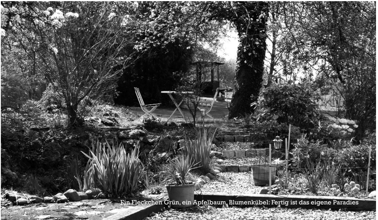
Ein Fleckchen Grün, ein Apfelbaum, Blumenkübel: Fertig ist das eigene Paradies

Zunächst ist es wichtig, dass der Kindergarten bestens ausgestattet und das Equipment auf dem neuesten Stand ist (»für die Kleinsten nur vom Feinsten«). Die Umgebung, Wände und Böden müssen schadstofffrei sein, damit keines der Kinder krank wird. Das Personal ist natürlich hoch qualifiziert und geht