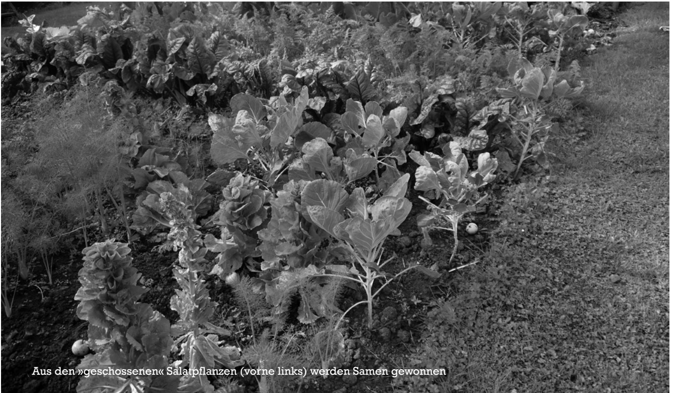
Aus den »geschossenen« Salatpflanzen (vorne links) werden Samen gewonnen