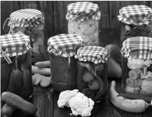
Gemüsekonserven – Ihr Wintervorrat

Noch einmal: Sie selbst bestimmen, wie weit Ihre Selbstversorgung gehen soll. Sind Ihnen 100 Quadratmeter noch zu groß? Fehlt Ihnen die Zeit dazu? In einem kleinen Stückchen Erde in Ihrem Vorgarten, ja, selbst in Kübeln auf Ihrer Terrasse oder auf Ihrem Balkon können Sie bereits einiges anbauen und das heranziehen, was Ihnen schmeckt. Mögen Sie zum Beispiel gern Tomaten? Dann konzentrieren Sie sich einfach auf dieses Gemüse. Vielleicht haben Sie Lust, zwischen den Stauden noch ein wenig Salat oder Kräuter anzupflanzen. Das ist ohne Weiteres möglich, sofern Sie Ihren Garten gut gedüngt haben. Je kleiner Ihr Gartenstückchen ist, umso mehr kommt es auf die Düngung an. Mit anderen Worten: Je mehr Kompost und Mist Sie in Ihre Erde »investieren«, umso mehr können Sie aus ihr herausholen. Im Golf von Neapel, an der Amalfiküste, bauen die Landwirte ihr Gemüse und ihr Obst auf drei verschiedenen Ebenen an: Auf der ersten Ebene gedeiht niedriges Gemüse, vor allem Zwiebeln, die