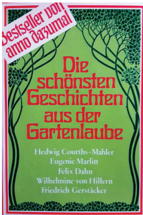
Bild 2.1: „Die schönsten Geschichten aus der Gartenlaube“, Pawlak, 1980, Umschlaggestaltung von H. Numberger (München), Cover [443]