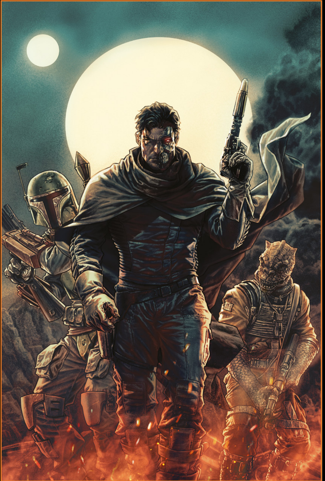
US-Bounty Hunters #1 Cover: LEE BERMEJO