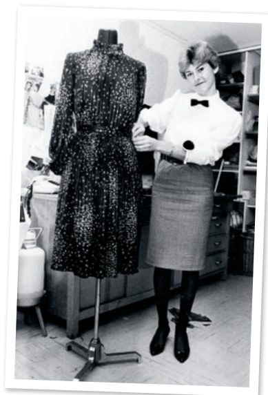
Am Tag meiner Betriebsgründung

1975 begann ich die Ausbildung zur Maßschneiderin. 1981, nach einigen Gesellenjahren als Maßschneiderin, absolvierte ich am 12.3.1981 die Meisterprüfung und eröffnete bereits einen Tag später mein eigenes Atelier. Ich bin inzwischen seit 44 Jahren in meinem Beruf tätig! In dieser Zeit habe ich mehr als 30 Lehrlinge zu Maßschneidern ausgebildet, davon haben bereits zwölf die Meisterprüfung absolviert. Drei der Meisterinnen arbeiten in meinem Atelier.