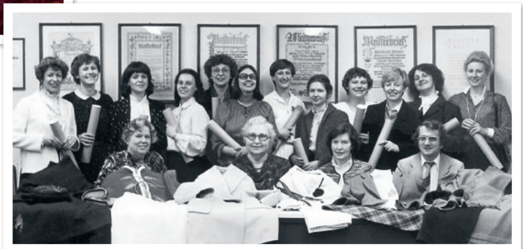
Bestanden! Die Meisterprüfung

Mein Meisterstück habe ich tatsächlich noch immer, es passt mir auch noch und ich könnte es heute fast noch so tragen. Es besteht aus einem dunkelblauen Mantel mit angeschnittenem Kelchkragen und einem asymmetrischen Rock mit Faltenpartie, Paspeltasche und Handknopflöchern aus demselben Material. Darunter eine schicke Seidenbluse mit kleinem Muster. Noch heute liebe ich Complots, die aus Mantel mit passendem Rock bestehen, das sieht einfach gut gestylt aus.