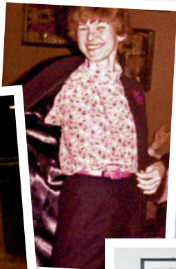
Stolz auf mein Meisterstück