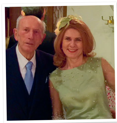
Mit meinem geliebten Papa