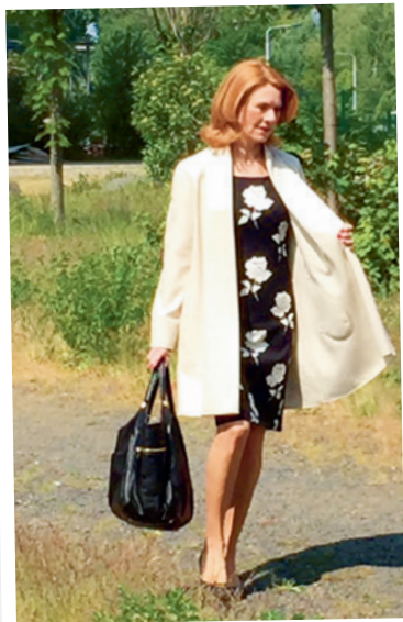
Im Lieblingsoutfit unterwegs

Das wechselt ständig, aber derzeit ist es ein cremefarbener, leichter und ungefütterter Mantel aus reinem Cashmere.