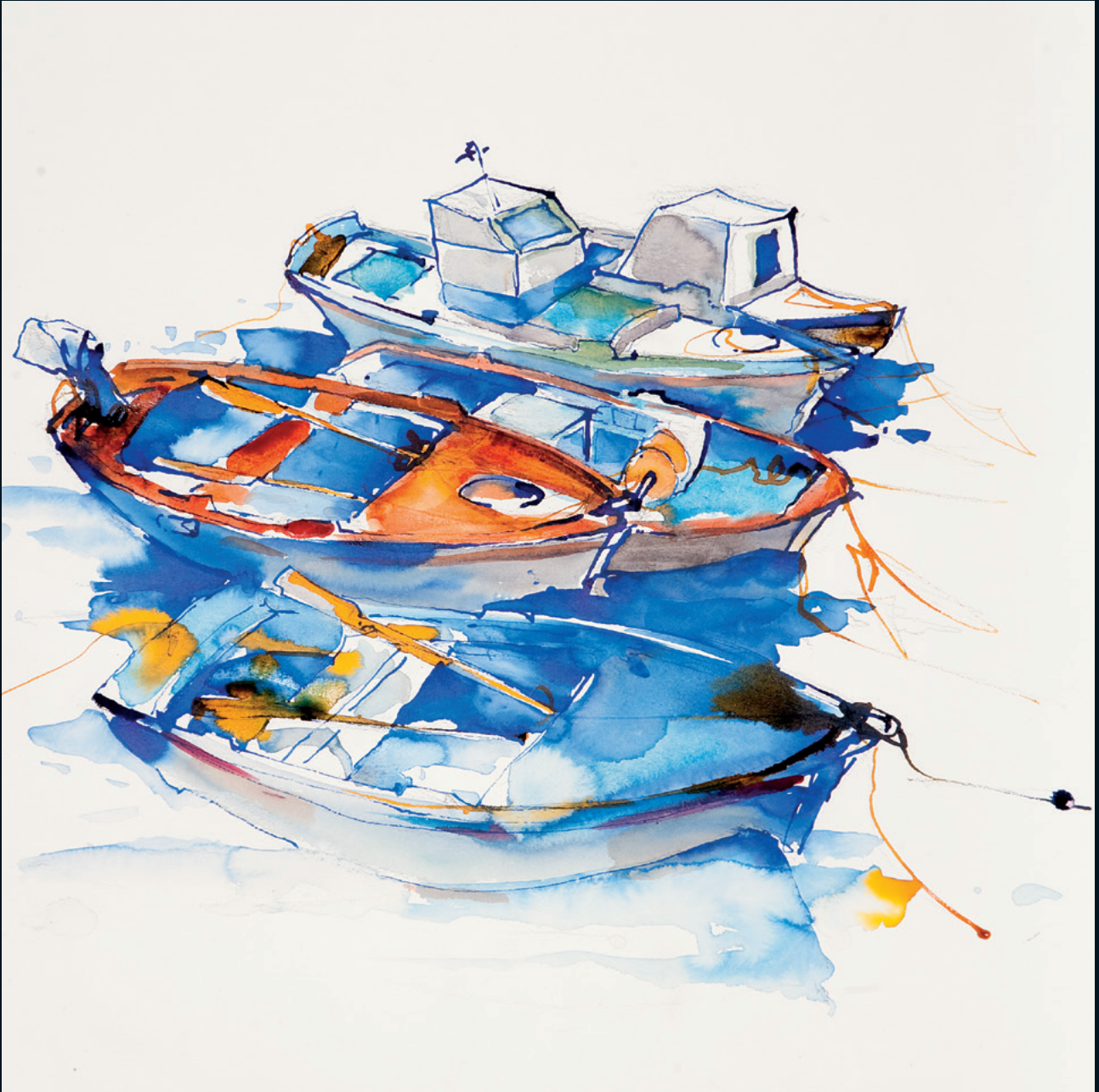
Schiffe Rohrfeder und Tinte auf Aquarellpapier