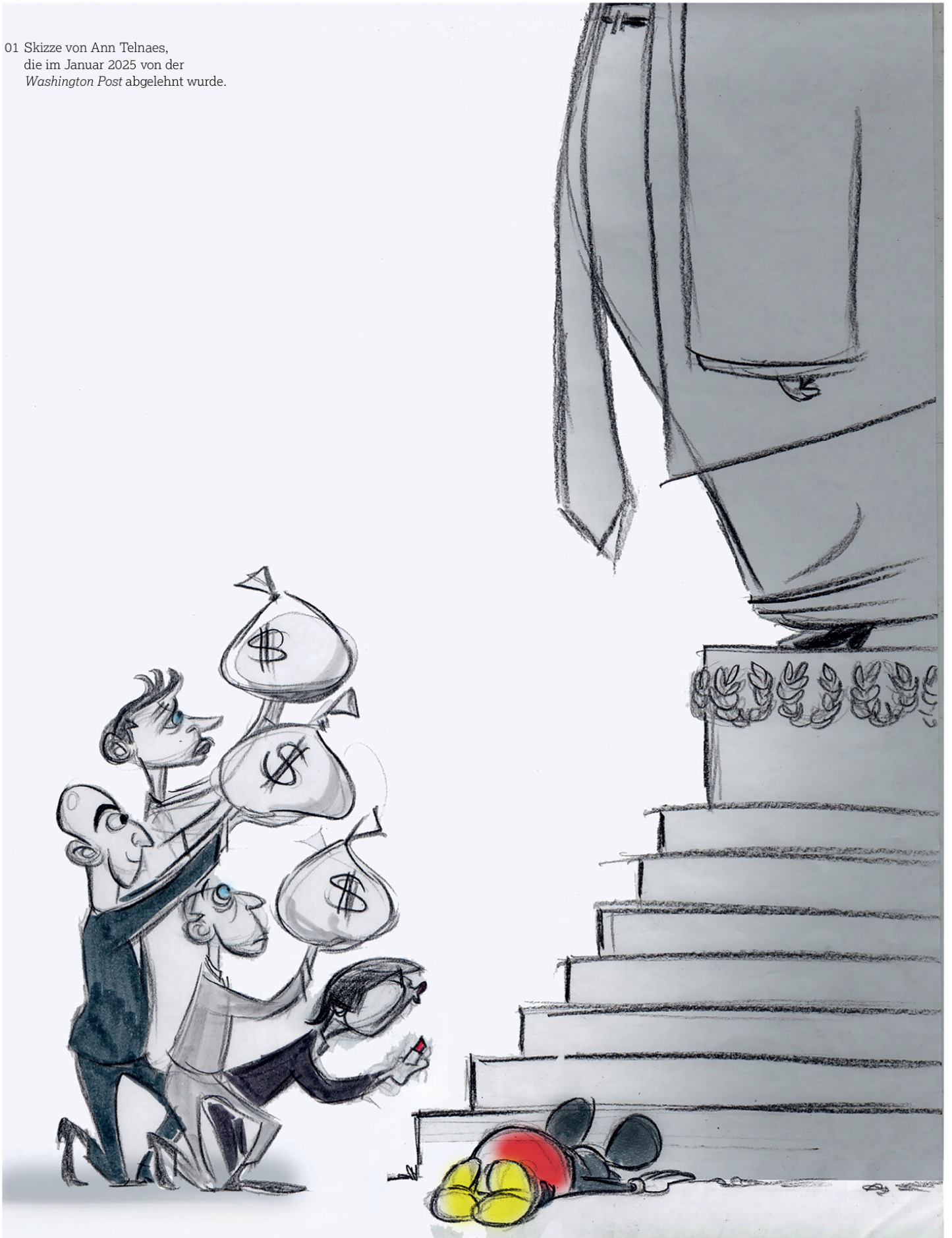
01 Skizze von Ann Telnaes, die im Januar 2025 von der Washington Post abgelehnt wurde.