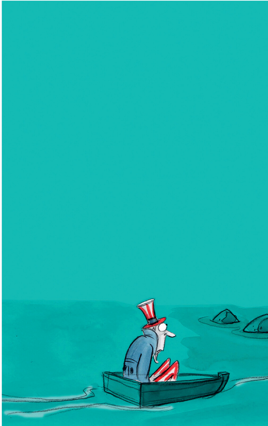
The Washington Post , 1. November 2016