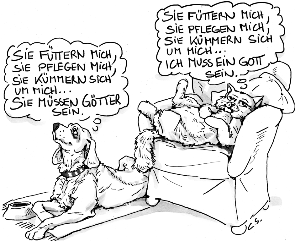
Abbildung 3.1 Unterschiedliche Attributionen von Hund und Katze

Abbildung 3.1 verdeutlicht, wie ein Ereignis unterschiedlich attribuiert werden kann. Das Verhalten der Menschen und das damit verbundene positive Erlebnis des Tieres (gefüttert, gepflegt und umsorgt zu werden), wird von der Katze selbstwertschützend erklärt, nämlich intern / stabil («Ich muss ein Gott sein»). Anders der Hund: Er attribuiert extern / stabil, d. h., andere sind dafür verantwortlich («Sie müssen Götter sein»).