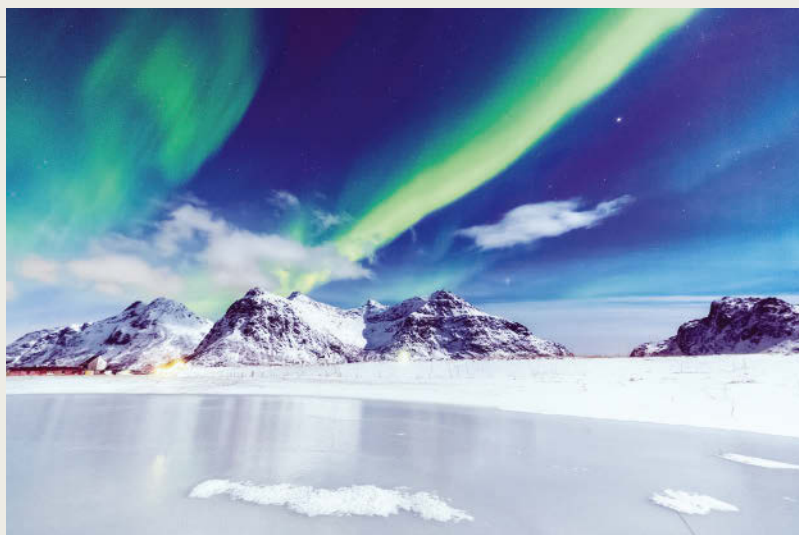
Die faszinierenden Lichtschauspiele – hier über der Westküste der Lofoten – sind vor allem zwischen September und März gut zu beobachten

andere ›magnetisch wirksame‹ Regionen auf dem Gestirn etwas abstrahlen, was aus Elektronen, Protonen und schweren Kernen besteht und Materie mit sich führt (das sogenannte Plasma), die zu gleichen Teilen aus positiver und negativer Ladung besteht, also elektrisch neutral ist. Diese Strahlung wird Sonnenwind genannt. Ihre Temperatur beträgt ca. 100 000 °C, und mit einer Geschwindigkeit von 300–900 km/s stürzt sie sich mitsamt eigenem Magnetfeld auf dasjenige der Erde.