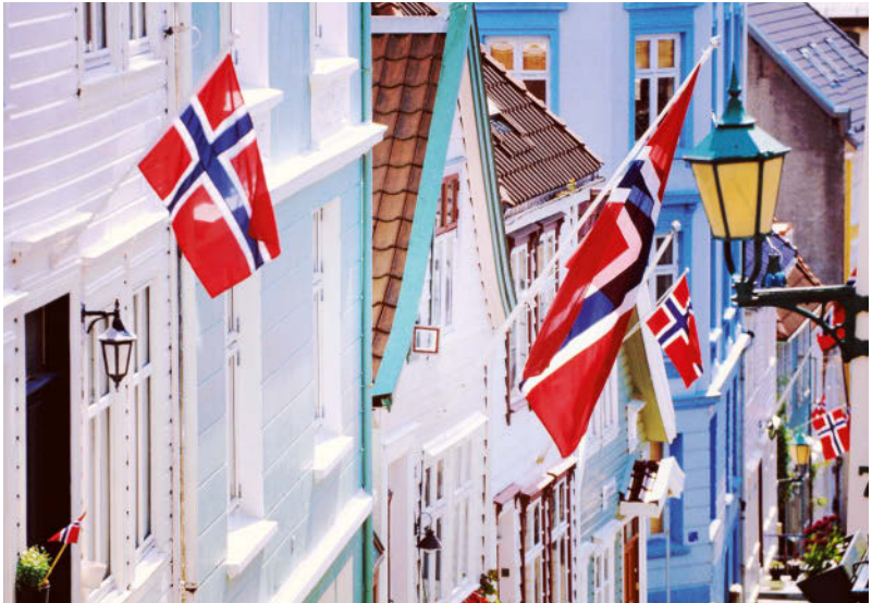
Am Nationalfeiertag werden die Straßen überall im Lande mit Fahnen geschmückt

auch weiterhin als eigenständiges Reich mit einer eigenen Tradition, verliert also in den Jahrhunderten der Fremdherrschaft nicht seine Identität. Das wird spätestens klar, als sich die Norweger weigern, den 1814 geschlossenen Kieler Vertrag anzuerkennen, der fest schreibt, dass Dänemark, als Verbündeter Napoleons zu den Verlierern der Napoleonischen Kriege zählend, Norwegen an Schweden abtreten muss. Das Volk ist empört, überall werden Proteste gegen die Abtretung laut, weil niemand, wie es heißt, das Recht habe, Norwegen einem fremden Land zu überlassen. In aller Eile werden jetzt Wahlen für eine konstituierende Versammlung abgehalten, die Gemeinden schwören den Eid, die Unabhängigkeit Norwegens zu verteidigen und Leben und Blut für ihr geliebtes Vaterland zu opfern.