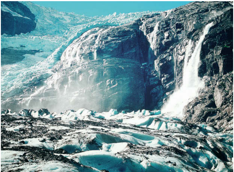
Gewaltige Gletscher formten einst tiefe Fjorde und bizarre Gebirgskämme

Als die landschaftlich eindrucksvollsten Zeugen der Eiszeit gelten die Fjorde , die sich weltweit überall dort gebildet haben, wo Gletscher in Trogtälern vom Gebirge herunterdrängten und in den Gezeitenbereich des Meeres gerieten. Das war, außer in der Arktis und Antarktis, u. a. in Kanada, Westschottland, Chile und Neuseeland der Fall, doch nirgendwo weisen die Fjorde derart markante Formen auf wie in Norwegen, das entsprechend auch ›Land der Fjorde‹ genannt wird.