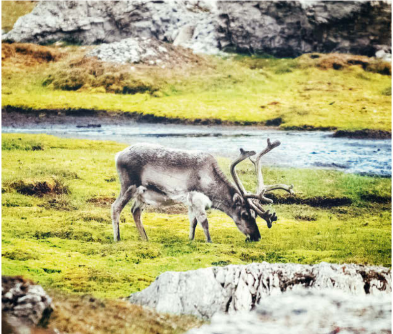
Fjell und Taiga bilden den Lebensraum der Rentiere

und in Norwegen, einem der gebirgigsten Länder Europas, hat diese Sonderform der Tundra, das Oreal (griech.: oros = Berg, Gebirge), sogar einen eigenen Namen: fjell .