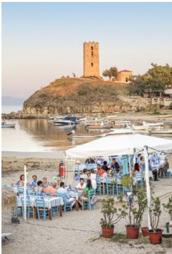
An der Hafenbucht von Néa Fókea ist der Weg des Fisches vom Boot auf den Teller kurz.

Ein paar Meter oberhalb der Bucht steht ein Wehrturm auf einem