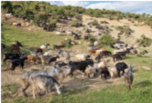
Schafe und Ziegen beleben die Landschaft der Chalkidiki