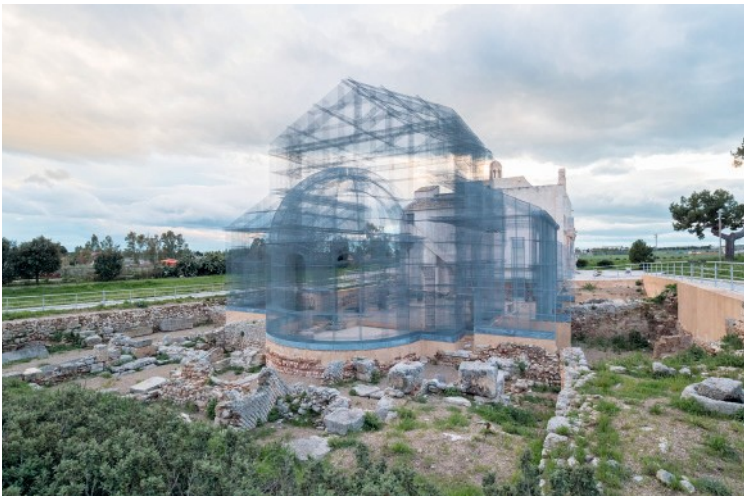
Nicht zu übersehen: Santa Maria di Siponto – Alt trifft Neu.

Alles begann recht vielversprechend, als die Cassa per il Mezzogiorno beschloss, Manfredonia als Industriestandort zu