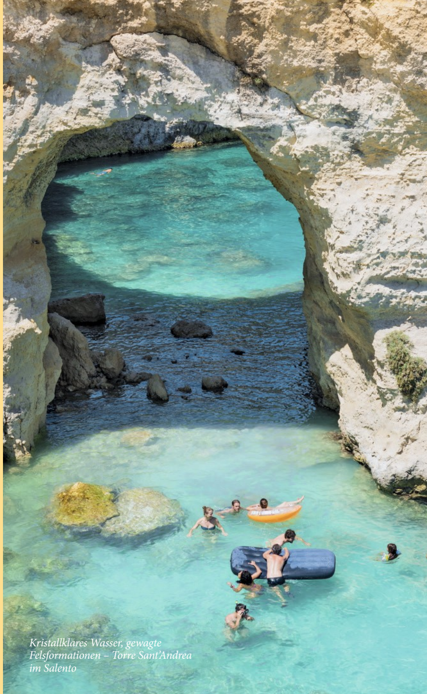
Kristallklares Wasser, gewagte Felsformationen – Torre Sant'Andrea im Salento