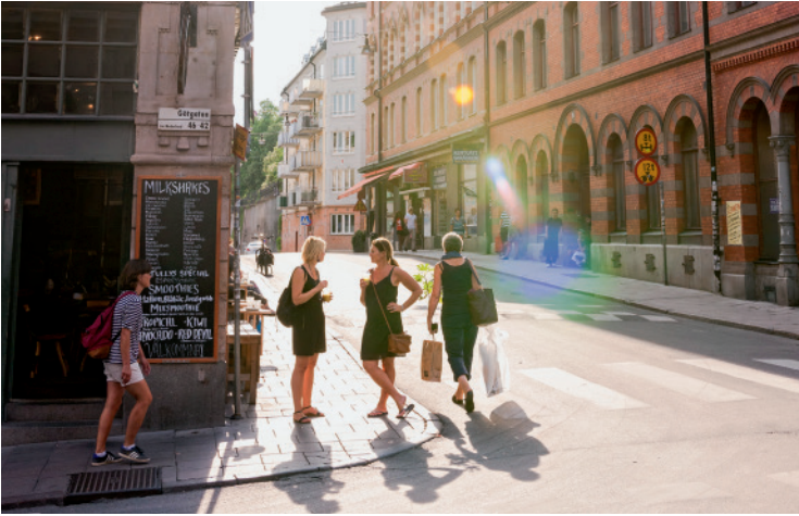
Bevor der Shoppingrummel beginnt: Götgatan in Södermalm kann auch aussehen wie eine ganz beschauliche Kleinstadtstraße.

wohner westlicher Vororte wie Rinkeby oder Tensta verdient im Schnitt nur 50 % dessen, was ein Durchschnittsbürger Östermalms nach Hause bringt. In den Vororten ist die Arbeitslosigkeit besonders hoch.