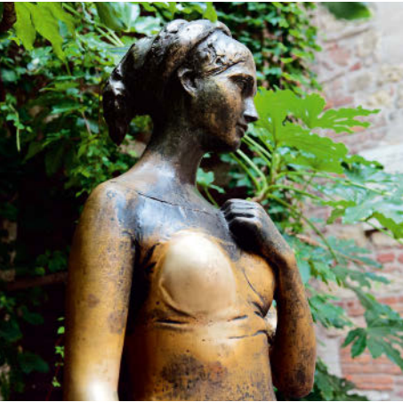
OBEN: Julia, ganz blank gegrapscht RECHTS: Jetzt fehlt unten nur noch Romeo.

jeder Besucher grapscht sie ungeniert an. Denn wer das tut, dem wird die Liebe ewig hold bleiben.