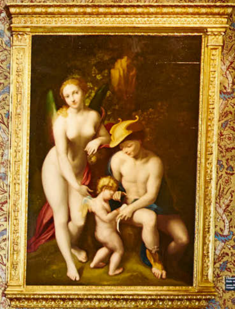
L'Amore di Venere di Sandro Botticelli 1485-1490