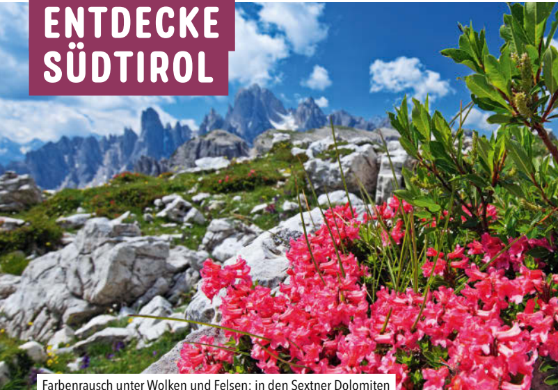
Farbenrausch unter Wolken und Felsen: in den Sextner Dolomiten

Marketingexperten lieben es verschurbelt. Nach dem Kern der Marke Südtirol gefragt, hat einer von ihnen vor Jahren allerdings mit Handfestem geantwortet: Knödel und Spaghetti. Die beiden kulinarischen Dauerbrenner stehen sinnbildlich für das, was Südtirol ausmacht – eine einzigartige Kombination aus Nord und Süd, aus Deutsch und Italienisch.