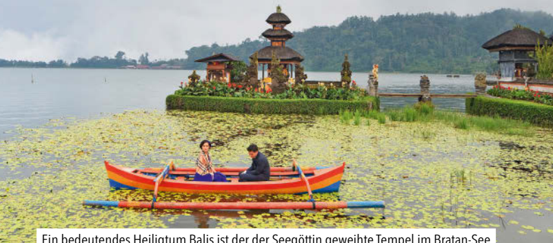
Ein bedeutendes Heiligtum Balis ist der der Seegöttin geweihte Tempel im Bratan-See

Palmengesäumte Sandstrände? Check. Traumhafte Unterwasserwelten? Gibt's. Reisterrassen und mächtige Vulkane? Unbedingt. Exotische Kultur und erschwingliche Preise? Aber hallo! Die Zutaten für einen tollen Urlaub sind auf Bali und Lombok reichlich vorhanden. Surfer, Taucher und Bergsteiger finden hier ihr Paradies, alle anderen dürfen sich auf eine fabelhafte Küche, relaxte Verwöhntage im Spa und sonnige Stunden mit Sand zwischen den Zehen freuen.