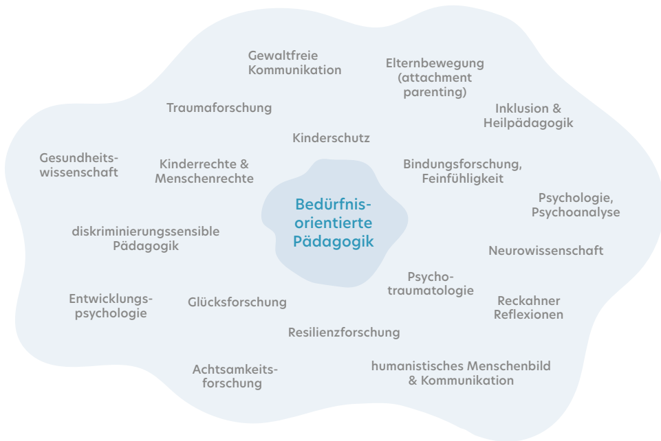
Abb. 1: Theoretische Einflüsse der BoP