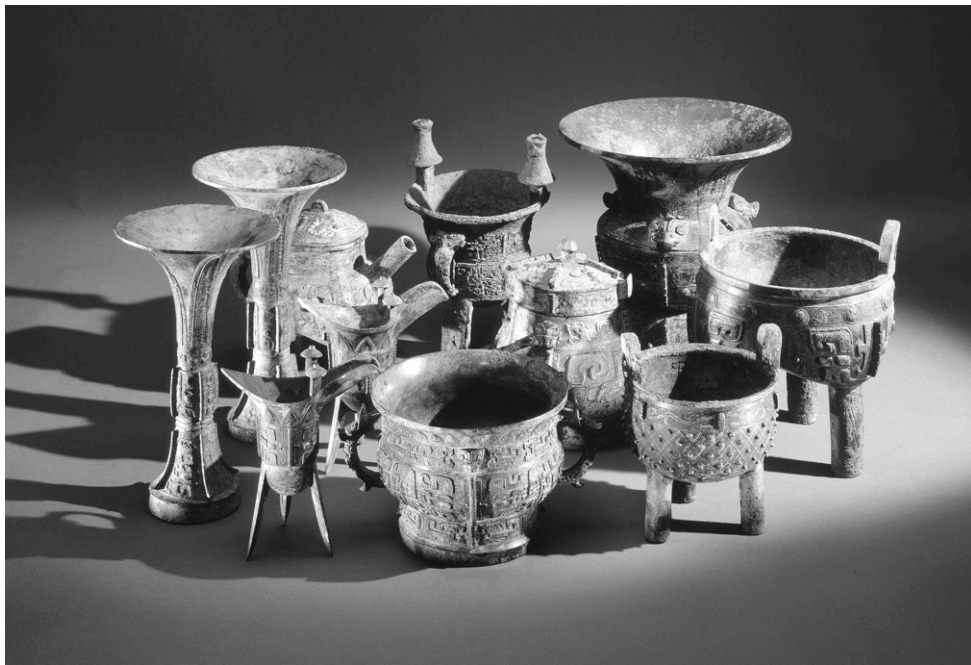
Figure 1 A group of late Shang ritual vessels, 12 th –11 th century BCE. British Museum

As we now know, sets of prescribed food and drinking vessel shapes were required by the elite to perform the necessary offerings. The components of sets of different periods have been deduced from the contents of Shang and the Zhou elite tombs and also from the hoards buried in the Zhouyuan 周原, when the Zhou fled east in 771 BCE. 5 Of course, the numbers and categories of these vessels employed in the Central Plains varied very significantly over time and were governed also by the hierarchical positions of their owners.