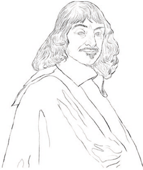
Bild 1.2 René Descartes

Der Homo interneticus geht nicht online – er lebt förmlich online. Die „Digital Natives 2.0“, die „selbständigen digitalen Eingeborenen“. Dieses Phänomen beeinflusst die Persönlichkeits- und Identitätsbildung. Die Identitätsentstehung ist ein ständiger Prozess, der im Dialog unserer inneren Bedürfnisse und dem gesellschaftlichen Wertesystem bzw. dessen Erwartungen steht. Das Feedback unserer Mitmenschen, unser soziales Umfeld nimmt dabei eine große Rolle in der Identitätsbildung ein.