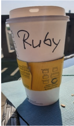
Bild 1 Kaffeebecher

Willkommen in der Zeit der Cyber- oder Internetpsychologie. Denn genau das steckt dahinter. Der Ursprung der Taktik, den Namen auf die Becher zu schreiben, galt Social-Media-affinen Menschen, also hauptsächlich jungen Menschen. Denn diese haben im Laufe der Social-Media-Prägung die Angewohnheit entwickelt, ein Foto von dem Kaffeebecher mit ihrem Namen darauf zu machen und dieses dann stolz zu posten und mit anderen zu teilen. Mit zahlreichen Hashtags und netten Sprüchen verziert, und haben ganz nebenbei natürlich auch das Unternehmenslogo gepostet. Doch irgendwann kam das Unternehmensmarketing auf die geniale Idee, die Namen absichtlich falsch zu schreiben. Je nach Kundentyp und Auftreten, immer im Rahmen des sozial Erwünschten. Denn würde so maximal Tennis heißen und nicht P... Denn wurde der Name falsch geschrieben, erhöhte dies die Chance, dass Social-Media-affine Menschen hiervon sofort ein Foto mit ihrem Smartphone machen und dieses gleich direkt auf die jeweiligen Portale posten. Der Marketing-Effekt war perfekt. Die Social-Media-Freunde waren geradezu begeistert, es dem gleichzutun. Effizienter und günstiger kann Marketing nicht sein. Das musste auch der Allgäuer in mir staunend zugeben. Genau wie dieses Beispiel funktioniert nun eben die Cyber- oder Internetpsychologie. Das Internet und die analoge Welt beeinflussen sich ständig gegenseitig. Eine Art digital-analoge Interaktion, man könnte im Falle des Kaffeeunternehmens sogar fast von einer Symbiose sprechen.