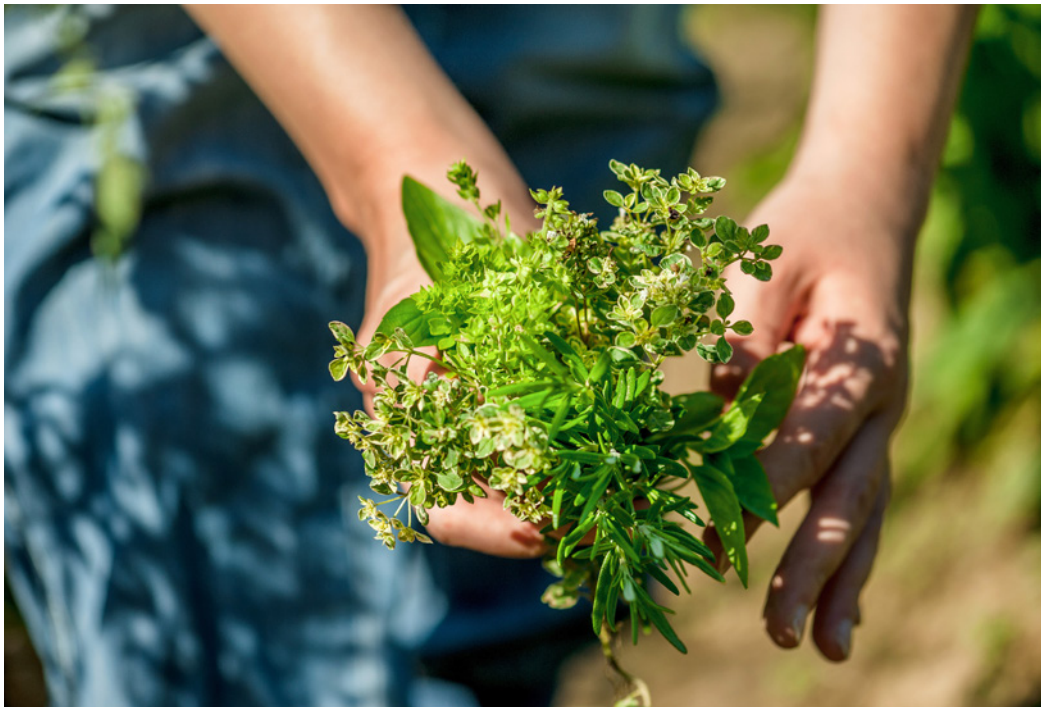
Ein Kräuterstrauß aus dem Garten voller Aroma: mit Rosmarin, Thymian und Minze.

deinen Kräutern verwendbar sind (siehe S. 42 ff.). Ob frisch oder getrocknet, Kräuter würzen unsere Speisen und helfen uns, gesund zu bleiben.