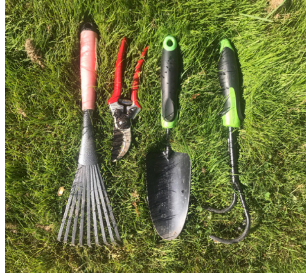
Handrechen, Gartenschere, Hand- oder Pflanzschaufel und eine kleine Harke zählen zu den Basics aller Gartengeräte.

Das beste Gartengerät nützt nichts, wenn es verschmutzt ist. Gartengeräte sollten nach jedem Einsatz gepflegt werden. Entferne nach jeder Nutzung Reste von Erde und öle die Geräte ein wenig ein, wenn du sie für längere Zeit nicht brauchst. Scheren und Messer müssen immer scharf und sauber sein, so geht die Arbeit gut von der Hand. Die Pflanzen werden es dir danken, denn sie vertragen den Schnitt besser.