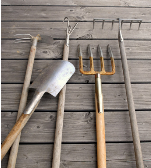
Harke, Spaten, Kultivator, Grabegabel und Rechen sind die wichtigsten Geräte für die Bodenbearbeitung.

zur Grundausrüstung gehören Schaufel und Grabegabel. Schaufeln werden zum Verteilen von Erde und Sand benötigt und die Grabegabel z. B. zum Ausheben größerer Pflanzen. Zur fachgerechten Bodenbearbeitung darf natürlich die Harke nicht fehlen. Sie dient dazu, die Beete glattzuziehen und sorgt dabei für eine krümelige Bodenstruktur. Sind die Beete bepflanzt, muss der Boden von Wildkräutern freigehalten werden: Leichte Böden kannst du gut hacken, bei schwereren wird der dreizackige Kultivator eingesetzt.