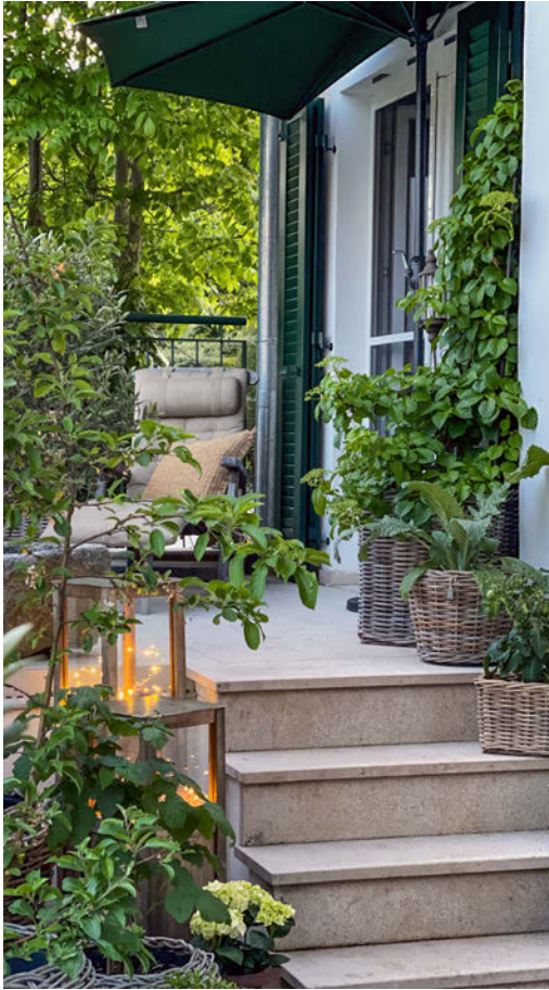
Auch auf kleinstem Raum können mit Kübelpflanzen Wohlfühl-Oasen entstehen!