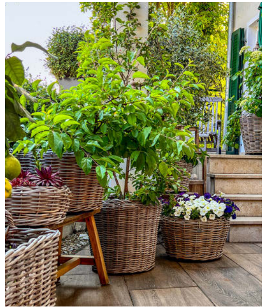
Im Topfgarten lässt sich leicht der richtige Standort finden.