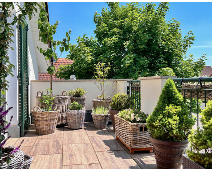
In meinem Topfgarten mag ich es nicht zu bunt. Daher achte ich darauf, dass ich bei den Kübeln nicht zu viele Materialien und Farben verwende.

Über viele Jahre habe ich mir viel Erfahrung und Wissen angeeignet und selbstverständlich auch den einen oder anderen leidvollen „Verlust“ erlitten! Aber aus Erfahrung wird man klug, und Aufgeben war für mich noch nie eine Option. Deshalb habe ich, um nur zwei Beispiele zu nennen, die Herausforderung bei Olivenbäumen oder Zitruspflanzen angenommen und es immer wieder versucht. Und mittlerweile gibt mir der Erfolg recht. Diese Erfahrungswerte, Tricks und Tipps gebe ich nun gerne auf den kommenden Seiten an euch weiter und zeige hier hoffentlich die eine oder andere „Wegabkürzung“ auf.