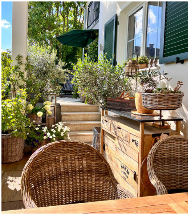
Mit meinen Töpfen und Kübeln schaffe ich immer wieder neue Blickwinkel.

Und genau da punktet der Topfgarten auf ganzer Linie, denn dank ihm können nicht nur kleine Terrassen und Balkone begrünt und mit Sichtschutz versehen werden, sondern auch kleine Grundstücke in grüne Oasen verwandelt werden. Durch ihre Mobilität sind Topfkulturen nicht nur flexibel einsetzbar, sondern auch saisonal wandelbar. Sie bringen Pflanzen und Blumen auf Terrasse und Balkon. Selbst auf engstem Raum ist mit ihnen der Anbau von Zierpflanzen, Kräutern, Gemüse und sogar Obst möglich.