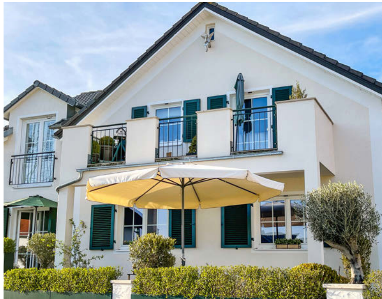
Unser Haus von der Straße aus. Hier kann man die Ligusterhecke gut sehen.