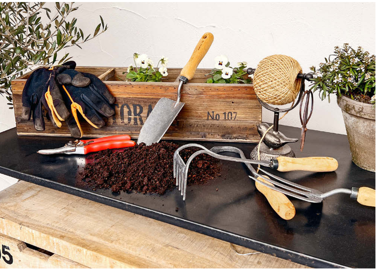
Handschuhe, Gartenschere, Pflanzkelle & Co. – viel braucht man nicht für das Gärtnern im Topfgarten.